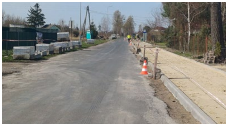
Budowa ciągu pieszo-rowerowego przy drodze powiatowej nr 2027 L w miejscowości Białka i Białka Kolonia

Dodatkowo, trwa intensywna przebudowa wraz z rozbudową drogi powiatowej nr 2015 L Puchaczów – Ciechanki – Kajetanówka od km 0+008,73 do km 8+255,00. W najbliższym czasie (II kwartał) przewiduje się zakończenie realizacji zadania. Wykonawca na całej długości kończy budowę ciągu pieszo-rowerowego oraz kładzenia warstw asfaltowych.