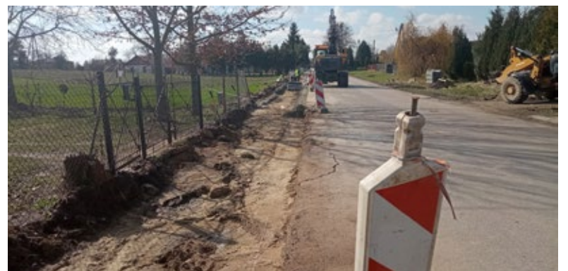
Budowa chodnika przy drodze powiatowej nr 2014 L w miejscowości Stara Wieś

przy drodze powiatowej nr 2027 L w miejscowości Białka i Białka Kolonia od km 5+599,00 do km 5+947,00” wraz z wyniesionym przejściem dla pieszych oraz peronami po obu stronach przejścia, w ramach konkursu dotyczącego poprawy bezpieczeństwa niechronionych uczestników ruchu, jak