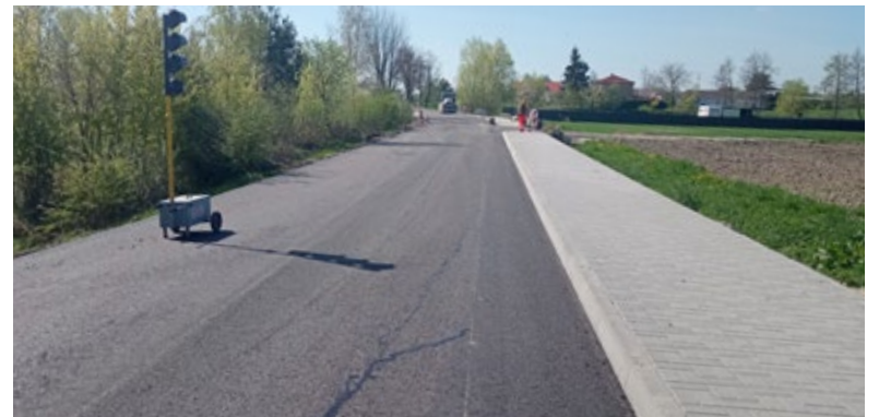
Przebudowa drogi w miejscowości Stręczyn

Dodatkowo trwają roboty w miejscowości Białka w ramach zadania „Budowa ciągu pieszo-rowerowego