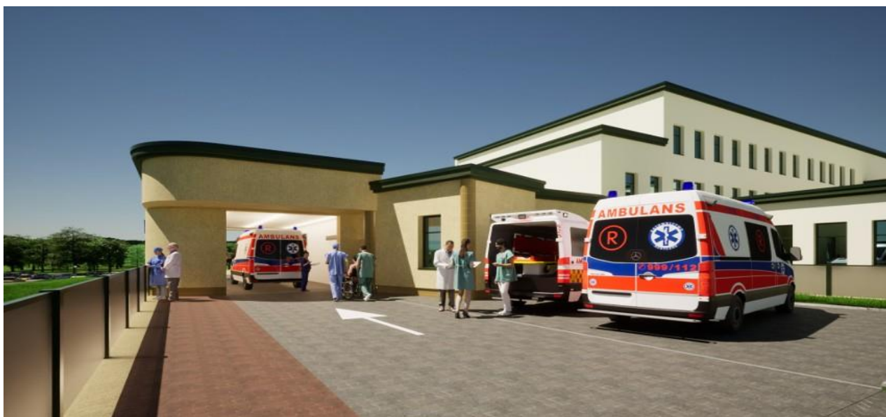
Szpitalny Oddział Ratunkowy SP ZOZ Łęczna

W roku 2023 w Samodzielnym Publicznym Zakładzie Opieki Zdrowotnej w Łęcznej rozbudowano i wyremontowano Szpitalny Oddział Ratunkowy, zbudowano nowe podjazdy dla karettek.