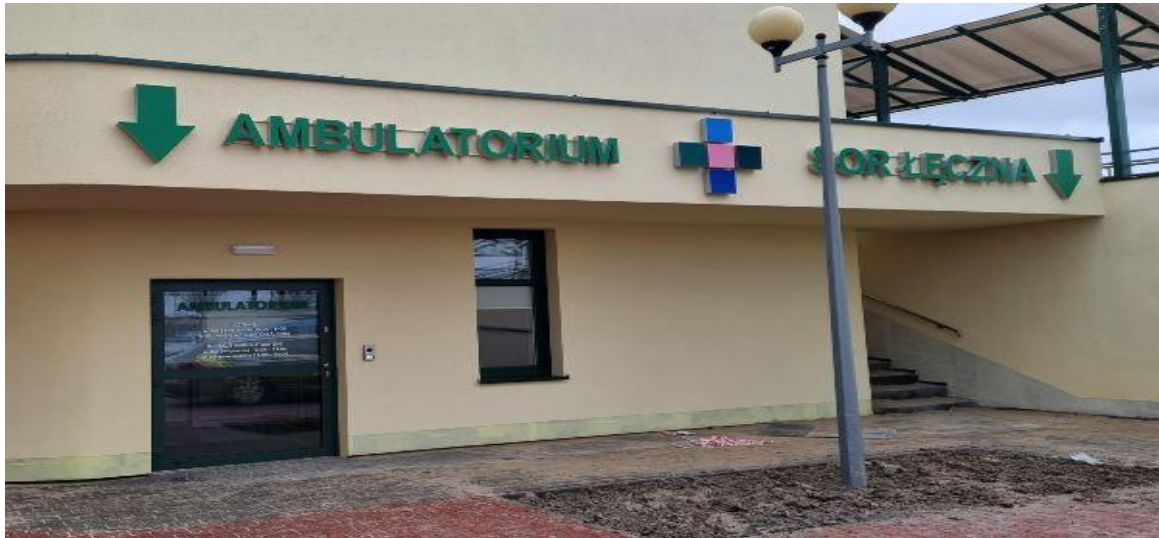
Szpitalny Oddział Ratunkowy SP ZOZ w Łęcznej