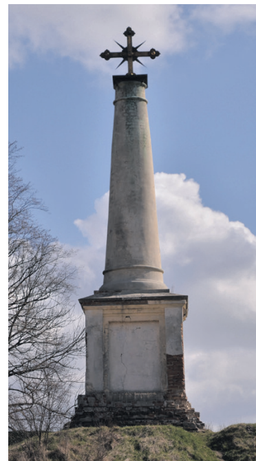
Krzyż z kopcem w zespole pałacowo-parkowym w Zawieprzycach.

1 274 000,00 na przeprowadzenie prac konserwatorskich