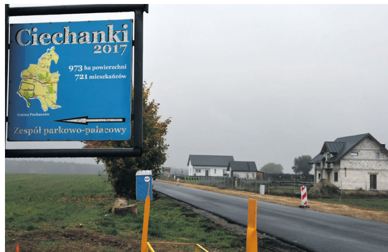
Przebudowa wraz z rozbudową drogi powiatowej nr 2015 L Puchaczów – Ciechanki – Kajetanówka