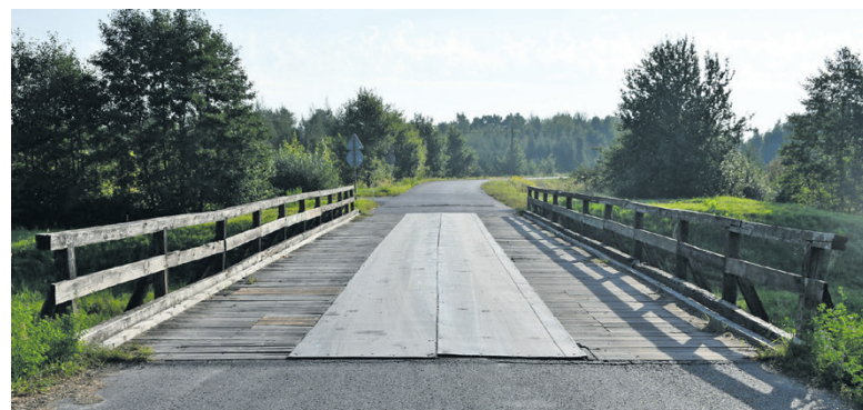
Remont mostu na kanale Wieprz – Krzna w miejscowości Zgniła Struga

– Zezulin od km 0 + 032,31 do km 5 + 470,00”. W ramach przedsięwzięcia zostanie wykonana nowa nawierzchnia, przejścia dla pieszych, skrzyżowanie oraz przebudowany istniejący chodnik. Koszt ogółem zadania to 16 728 848,41 zł. Przewidziany okres realizacji od czerwca 2024 r.