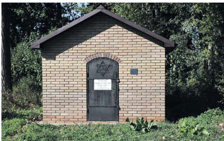
Cmentarz Żydowski w Łęcznej.