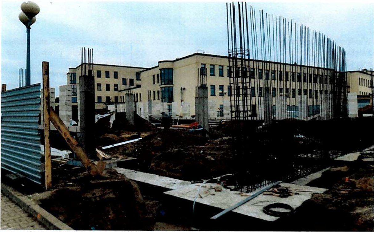
Centrum Opieki Senioralnej SP ZOZ w Łęcznej na etapie budowy