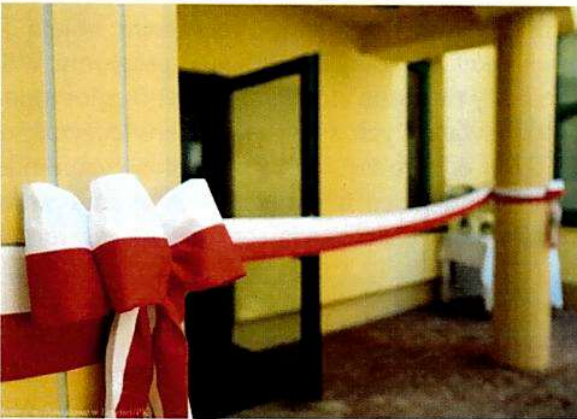
Centrum Opieki Senioralnej SP ZOZ w Łęcznej