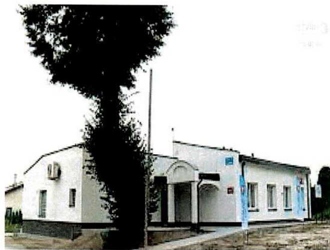
Dzienny Dom Senior + w Jaszczowie