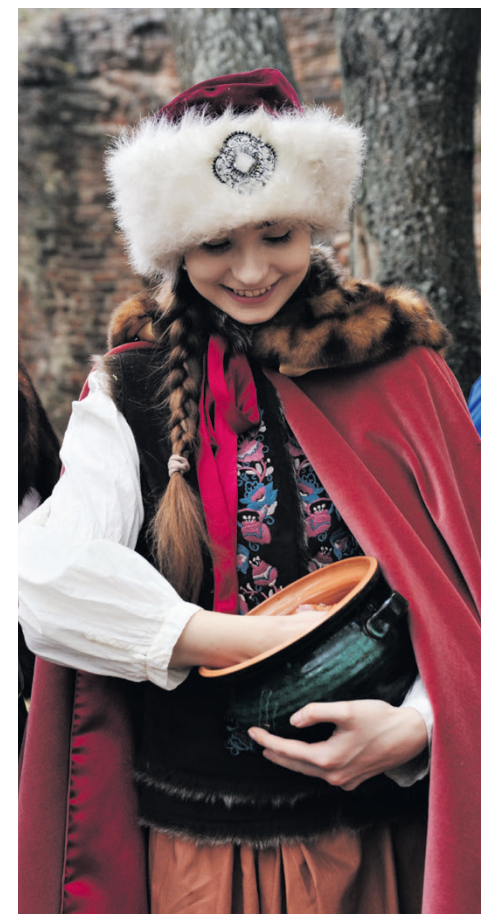
W Zawieprzycach serwowano potrawy z czasów Jana III Sobieskiego