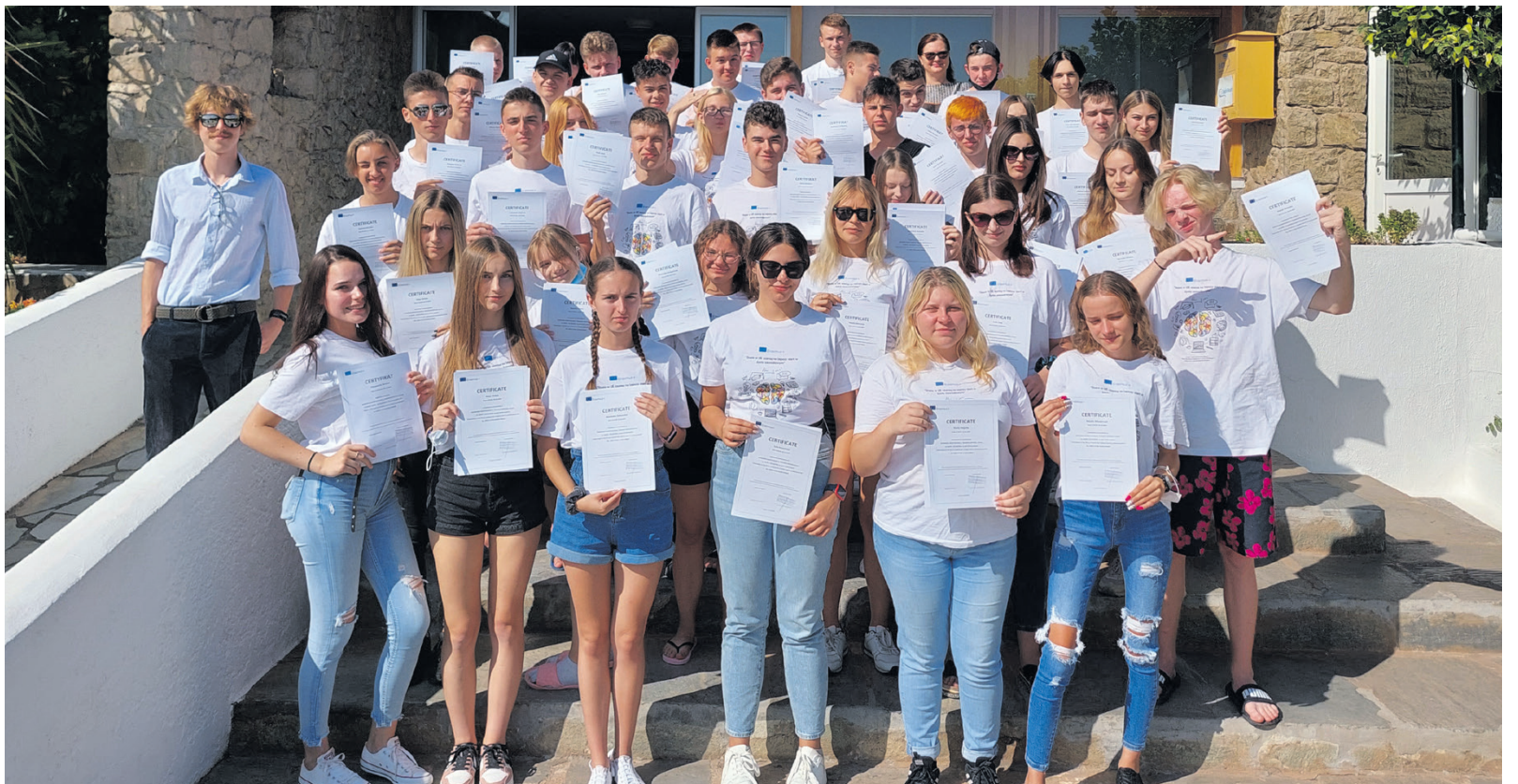
Uczniowie Zespołu Szkół im. Króla Kazimierza Jagiellończyka w Łęcznej podczas praktyk zagranicznych w Grecji.

Czas wolny uczniowie spędzali na wycieczkach, grach terenowych czy też korzystali z dobrodziejstwa greckiego klimatu na plaży nad Zatoką Koryncką. Jedną z wielu atrakcji, podczas pobytu, była całonocna wycieczka do Olimpii – starożytnego miejsca kultu Zeusa oraz igrzysk olimpijskich, gdzie uczniowie mieli szansę zobaczyć pozostałości