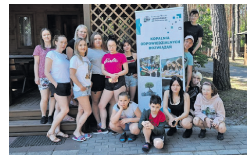
Wychowankowie Placówki Opiekuńczo-Wychowawczej w Kijanach, podczas wyjazdu rekreacyjno-integracyjnego na Roztocze

W ramach projektu, w dniach 7–9.06.2021 r. cała społeczność PO-W Dom nr 2, wraz z wychowawcami wspierającymi, udała się na wyjazd rekreacyjno-integracyjny do Suśca. W samym sercu Roztocza, w środku lasu spędzili magiczne dwie doby. W dniu 11.06.2021 r. z programu „Radość i Rozwój”, podopieczni PO-W Dom nr 1 wraz z wychowawcami udali się na wycieczkę