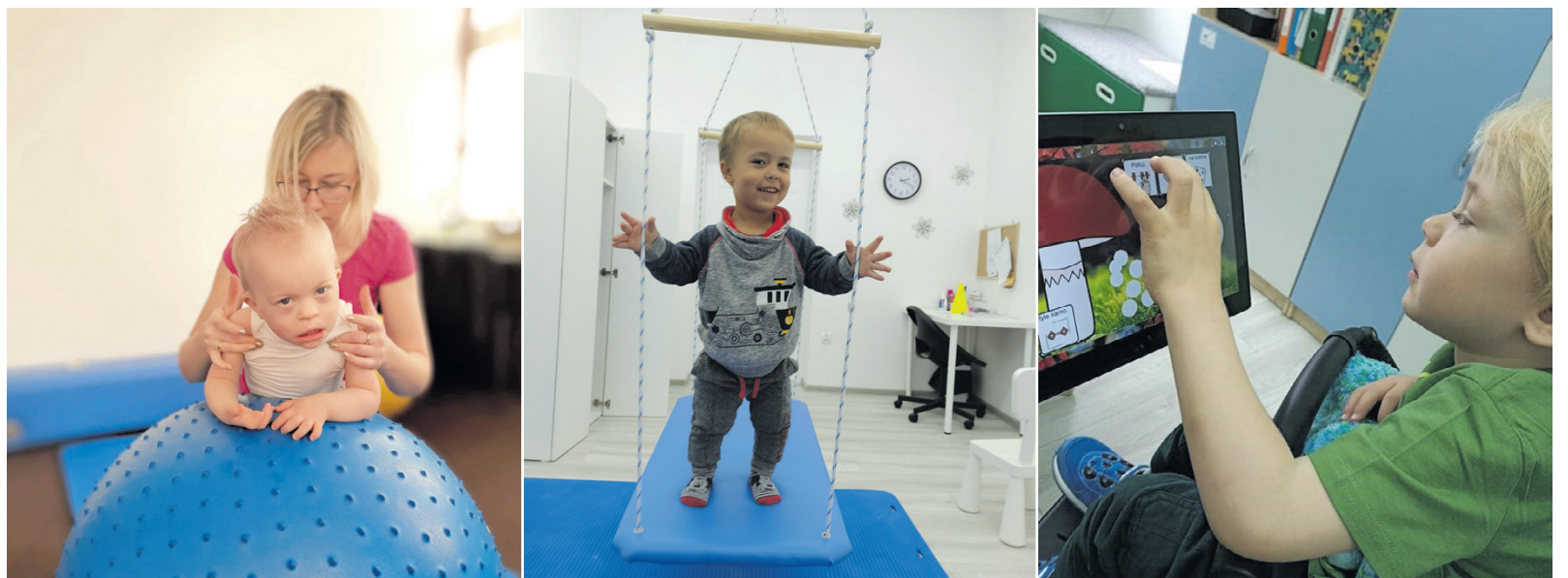
Podopieczni placówki, podczas codziennych zajęć rehabilitacji ruchowej oraz terapii pedagogicznej.

W Przedszkolu Specjalnym w Ludwinie, każde dziecko znajduje opiekę i edukację w mniejszych liczebnie grupach (4 – 5 osobowych). Dziećmi zajmuje się zaangażowana i wysoko wykwalifikowana kadra, oferująca codzienną, indywidualną rehabilitację ruchową, codzienną terapię pedagogiczną i neurologopedyczną oraz zajęcia grupowe. Zespół specjalistów wykorzystuje różne metody, aby w pełni oddziaływać na dzieci, zapewniając im maksymalną możliwość rozwoju. Należy tutaj wymienić: Metodę Dobrego Startu, Program Aktywności I Komunikacji Knillów, Bajkoterapię, Pedagogikę M. Montessori, Arteterapię, Integrację sensoryczną, Metodę Ruchu Rozwijającego Weroniki Sherborne, elementy Metody Peto, AAC, Muzykoterapię, Poranny Krąg,