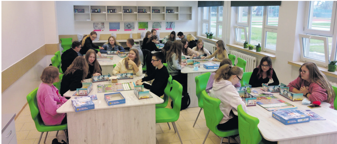
Uczniowie Zespołu Szkół im. Króla Kazimierza Jagiellończyka w Łęcznej w nowej pracowni biologicznej, uczestniczący w zajęciach w ramach projektu „Gra na start! Edukacja przedsiębiorcza młodzieży z wykorzystaniem planszowej gry edukacyjnej”.

Dzięki Starostwu Powiatowemu w Łęcznej, wspomniana sala informatyczna została rozbudowana i doposażona w wydajne stanowiska komputerowe, z zainstalowanym specjalistycznym oprogramowaniem, na potrzeby zarówno kształcenia zawodowego, jak i ogólnokształcącego.