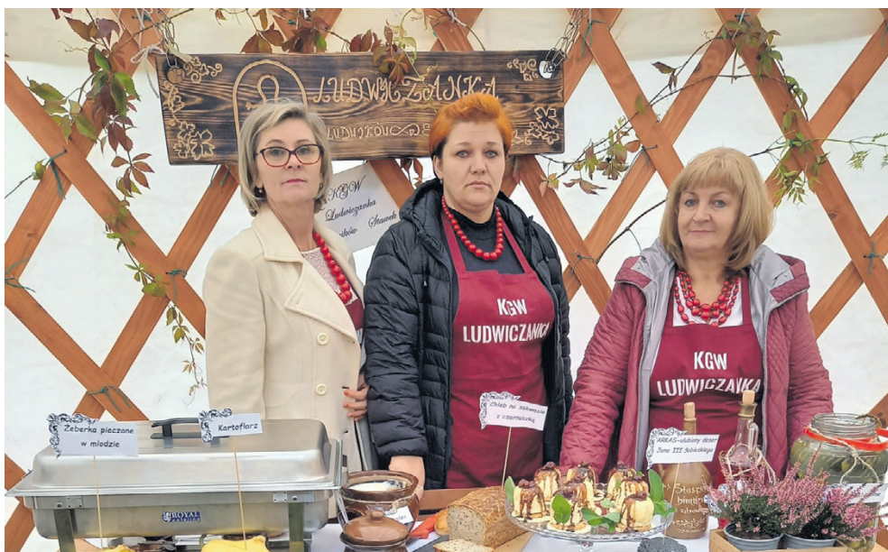
Członknie KGW „Ludwiczanka” przygotowały m.in. wyśmienity „Deser Sobieskiego”