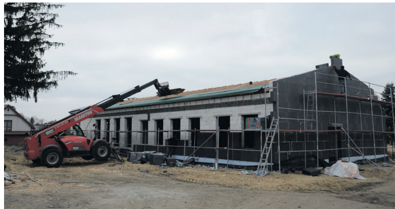
Nowa inwestycja w trakcie budowy.

międzywojennym, później był wielokrotnie remontowany i przebudowywany. Służył pacjentom do 2009 roku, do czasu powstania szpitala w Łęcznej. Teraz w miejscu starego obiektu powstanie budynek nawiązujący wizualnie pewnymi elementami do architektury poprzednika, ale będzie to funkcjonalny i nowoczesny budynek zaprojektowany tak, by spełniał potrzeby osób starszych.