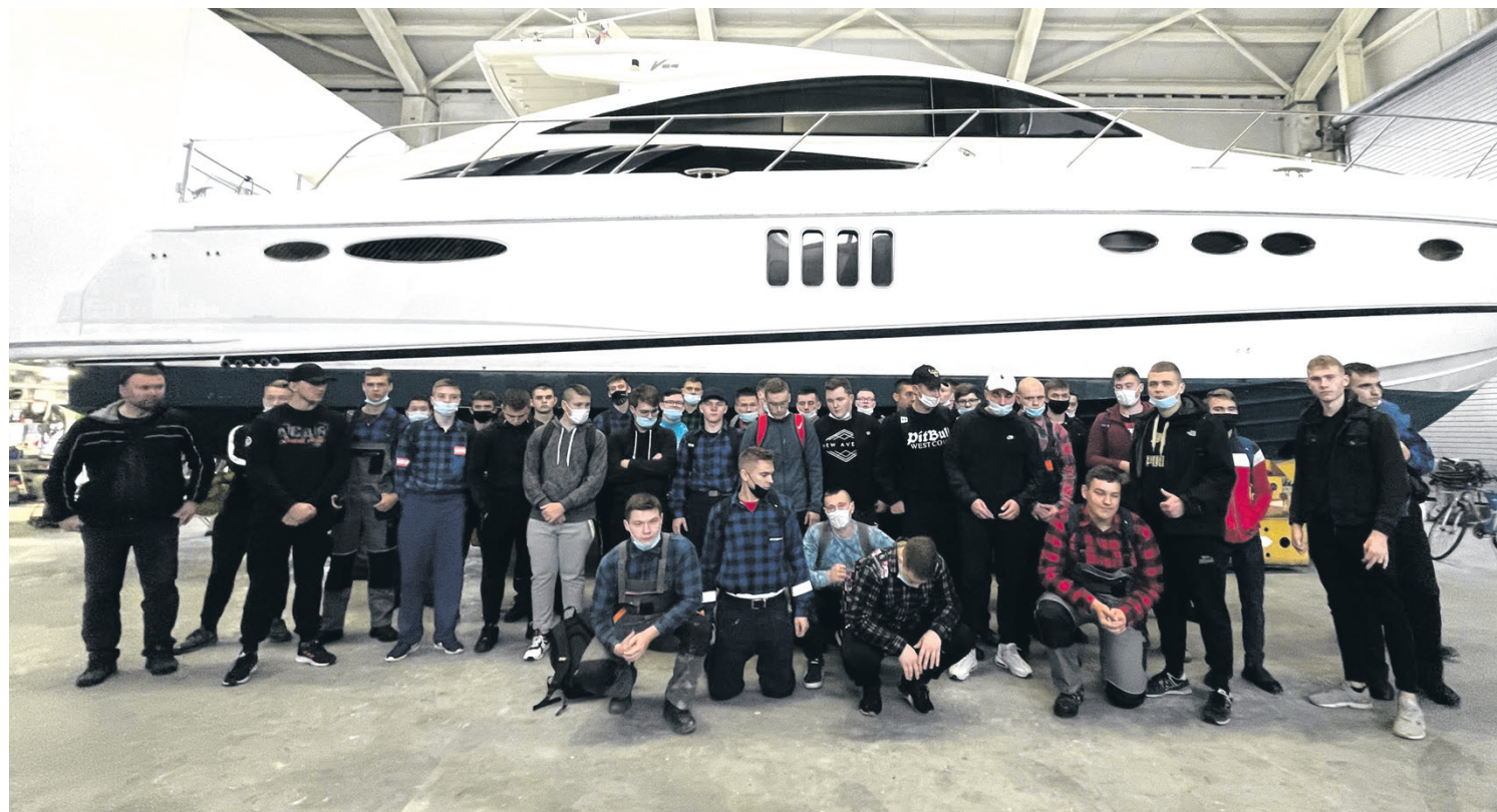
Uczniowie ZSG w Łęcznej na praktykach w stoczni w Ravenna Boat Service, w Marina di Ravenna