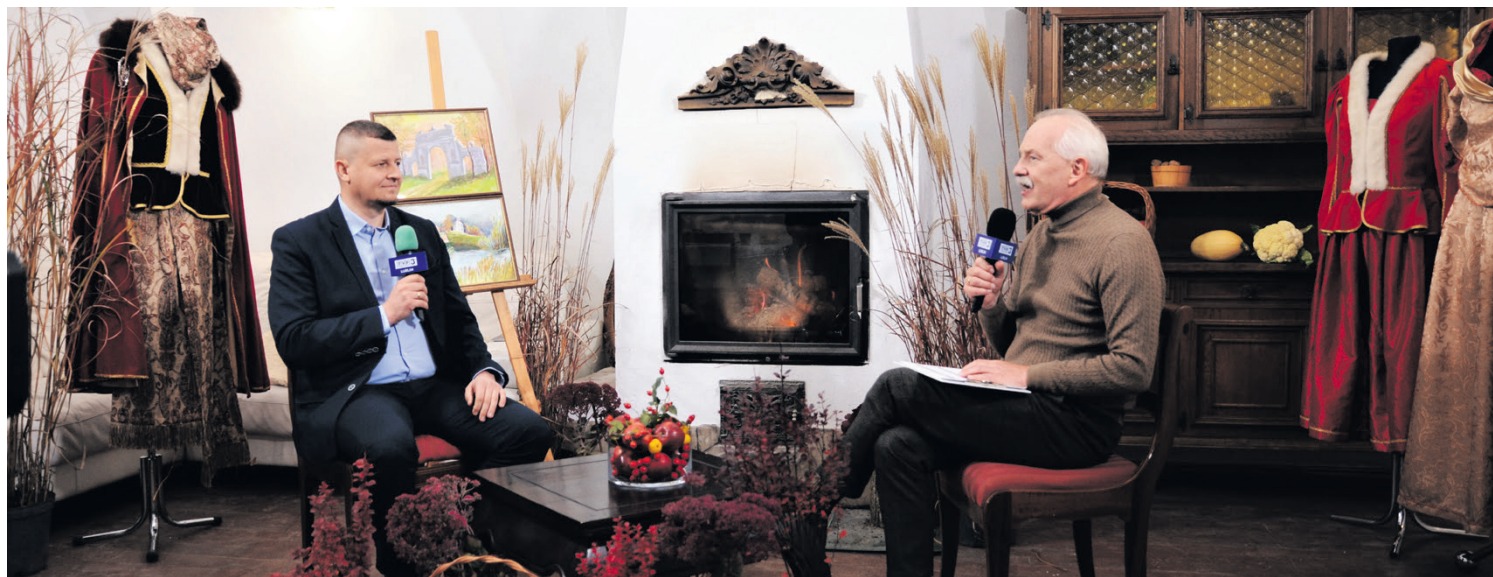
Wicestarosta Łęczyński podczas rozmowy na temat remontu dróg i ścieżek rowerowych, a także planowanych inwestycji kolejowych na terenie powiatu łęczyńskiego.