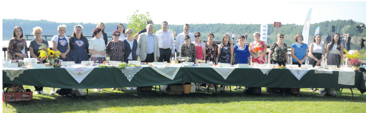
Uczestnicy projektu „Zielarstwo od tradycji do współczesności”

w siedzibie Starostwa Powiatowego w Łęcznej.