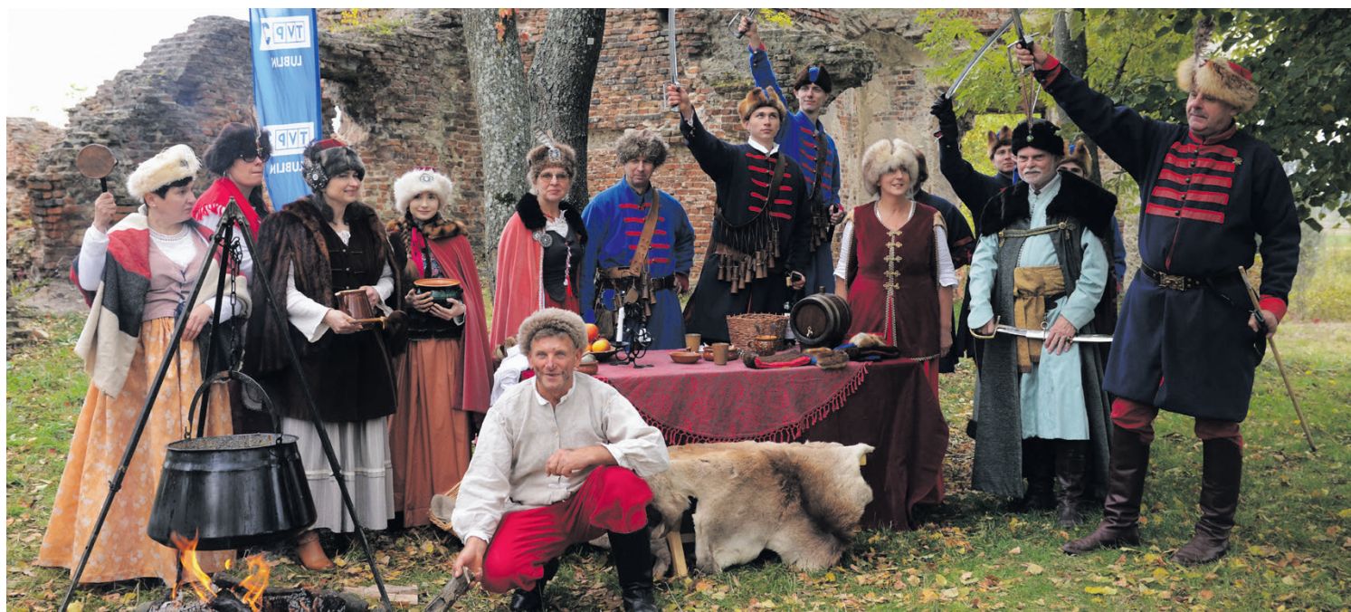
Członkowie Stowarzyszenia „Chorągiew” Zamku w Zawieprzycach.