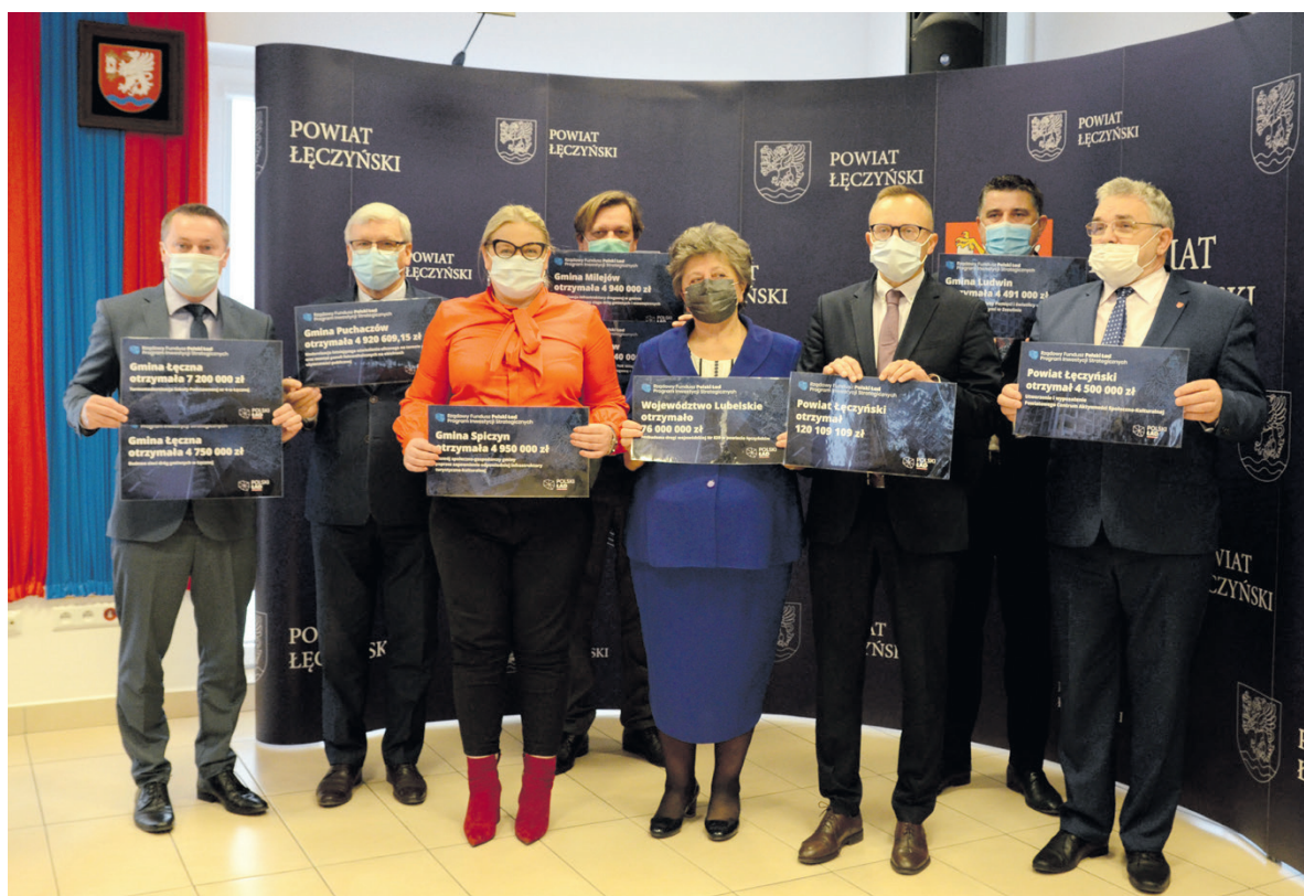
Wręczono symboliczne czeki dla przedstawicieli poszczególnych gmin i Powiatu Łęczyńskiego