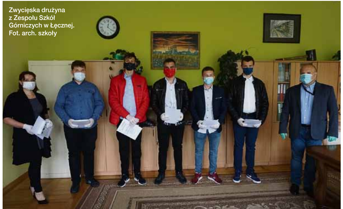
Zwycięska drużyna z Zespołu Szkół Górniczych w Łęcznej.