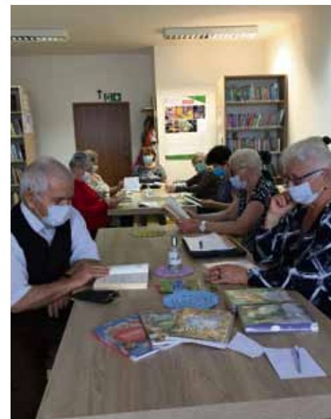
Spotkanie klubu czytelniczego.