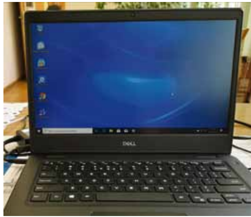
Uczeń „Bolivara” wygrał dla szkoły 16 notebooków oraz szafę do ich przechowywania i ładowania.