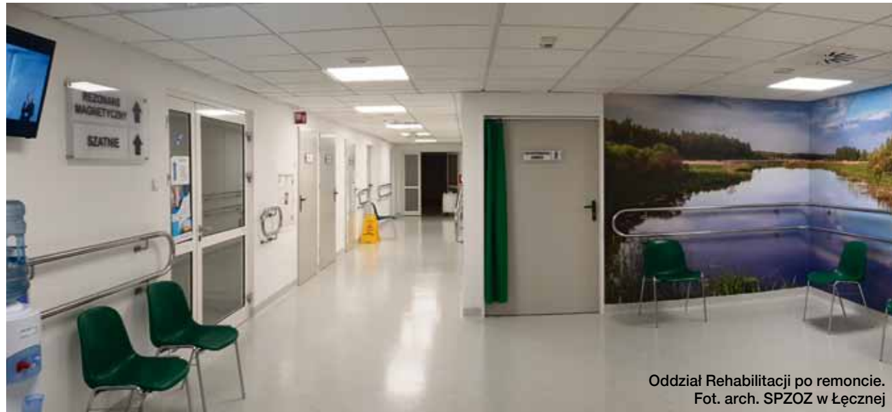
Oddział Rehabilitacji po remoncie.