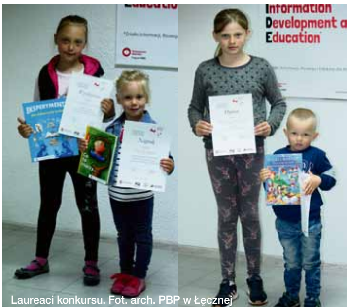
Laureaci konkursu.