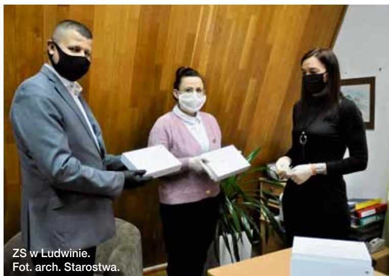
ZS w Ludwinie.