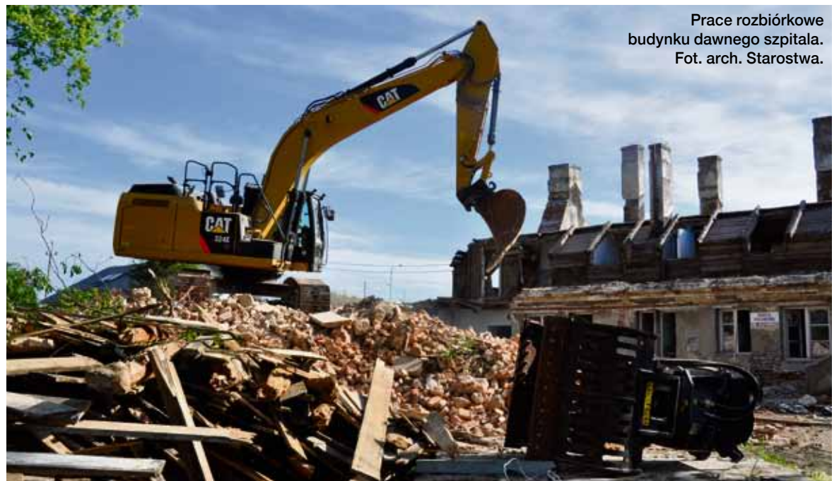
Prace rozbiórkowe budynku dawnego szpitala.