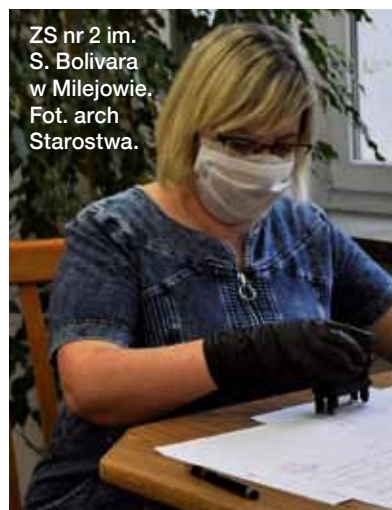
ZS nr 2 im. S. Bolívara w Milejowie.