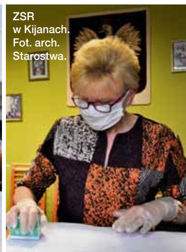
ZSR w Kijanach.