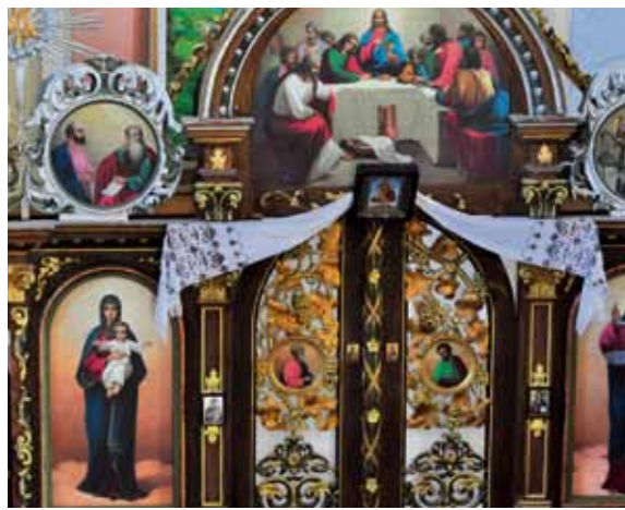
W świątyni znajduje się ikonostas sprowadzony z Sanoka w latach 50. XX wieku.