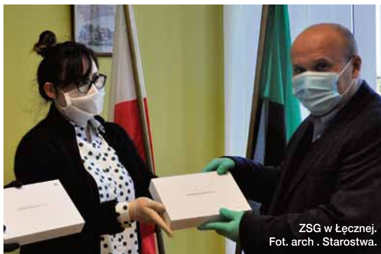
ZSG w Łęcznej.