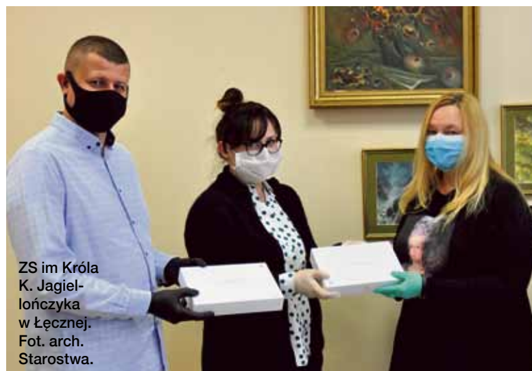
ZS im. Króla K. Jagiellończyka w Łęcznej.