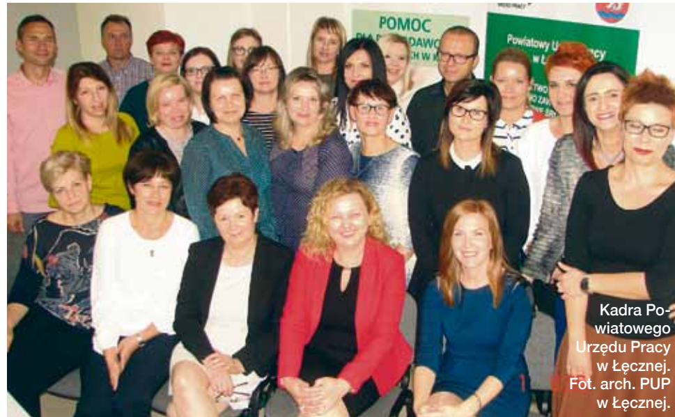
Kadra Powiatowego Urzędu Pracy w Łęcznej.