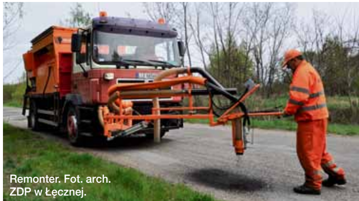
Remonter. Fot. arch. ZDP w Łęcznej.

Mimo, iż remonter jest w użyciu od niedawna, to ZDP systematycznie poprawia jakość naszych dróg. Dobiegły końca prace budowlane na