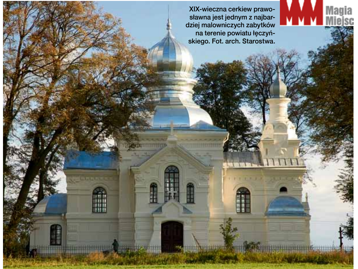
XIX-wieczna cerkiew prawosławna jest jednym z najbardziej malowniczych zabytków na terenie powiatu łęczyńskiego.