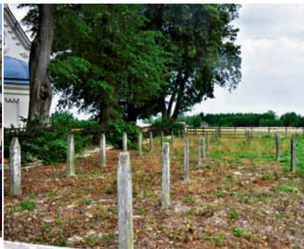
Cmentarz wojenny.