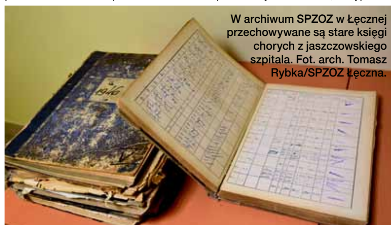
W archiwum SPZOZ w Łęcznej przechowywane są stare księgi chorych z jaszczowskiego szpitala.

Zachęcamy wszystkich, którzy chcieliby się podzielić posiadanymi pamiątkami związanymi z dawnym szpitalem w Jaszczowie, do przekazania ich Starostwu Powiatowemu w Łęcznej.