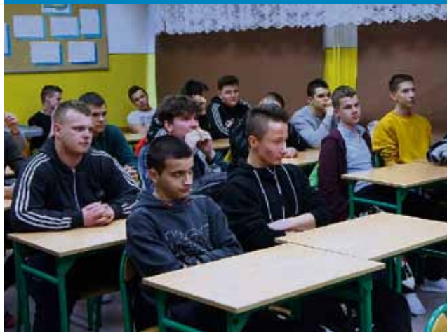
Spotkanie z policjantkami w Zespole Szkół Górniczych w Łęcznej – 6 marca

Konsekwencje cyberprzemocy, mowa nienawiści, odpowiedzialność prawna młodocianych, sankcje za narkotyki – te i wiele innych kwestii było poruszanych podczas spotkania edukacyjnego z uczniami, prowadzonego przez funkcjonariuszki KPP w Łęcznej.