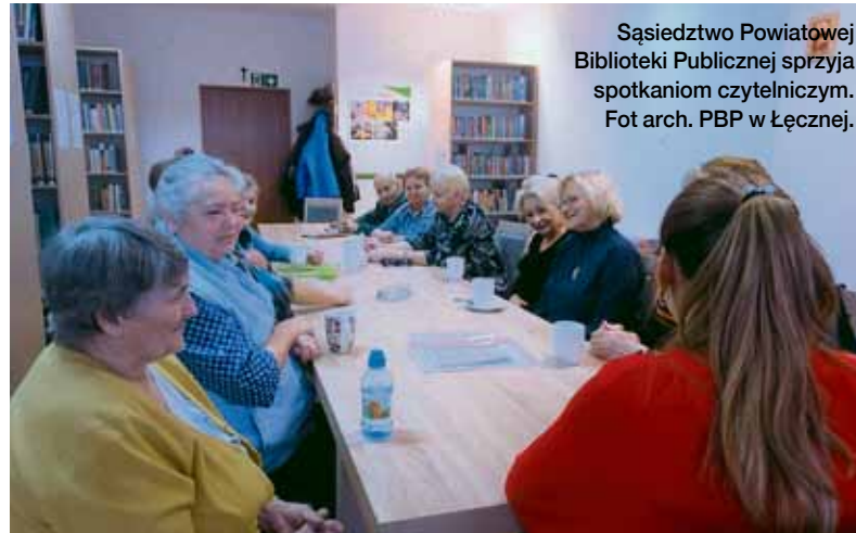
Sąsiedztwo Powiatowej Biblioteki Publicznej sprzyja spotkaniom czytelniczym.