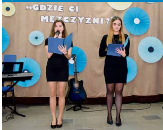
Koncert w „Jagiellończyku” z okazji Dnia Mężczyzny – 10 marca

Podczas wydarzenia zorganizowanego z myślą o lokalnej społeczności młodzież wykazała się nie tylko talentem muzycznym, ale także zdolnościami aktorskimi i kabaretowymi.