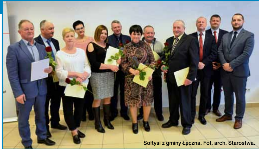
Sołtysi z gminy Łęczna.