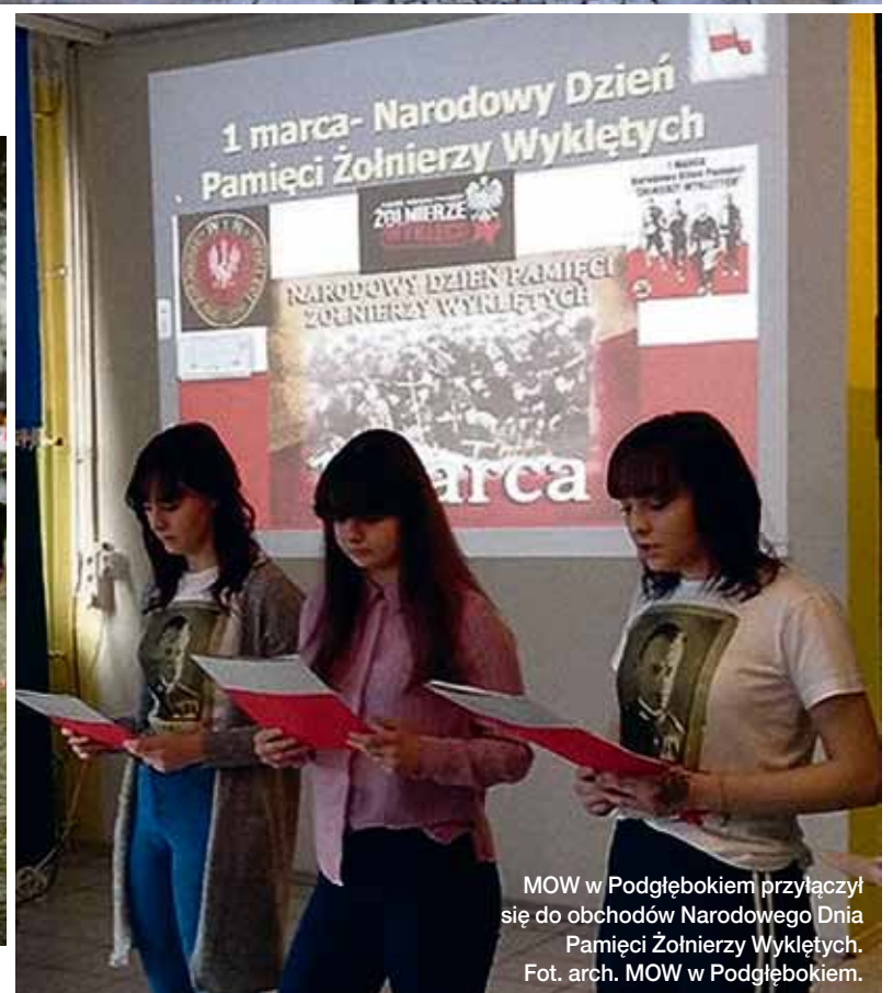
MOW w Podgłębokiem przyłączył się do obchodów Narodowego Dnia Pamięci Żołnierzy Wyklętych.