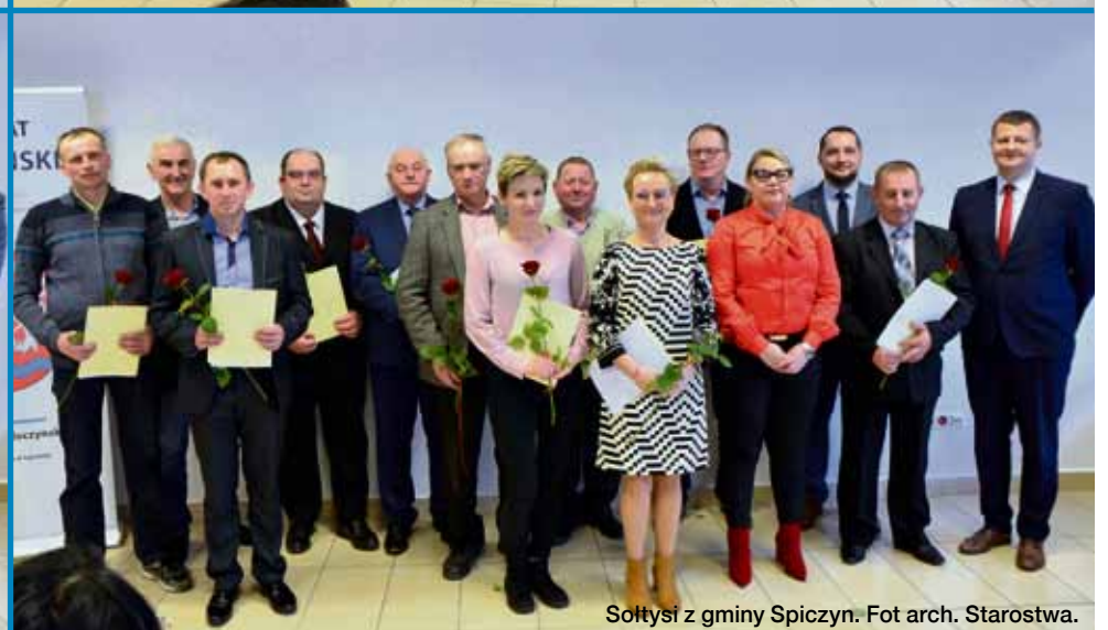
Sołtysi z gminy Spiczyn.