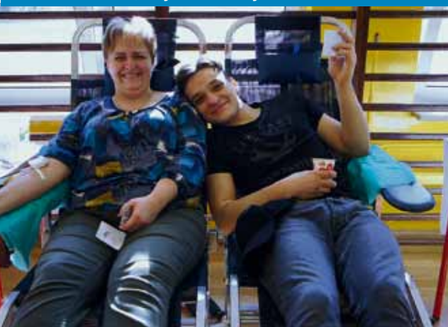
Podarowali krew, aby ratować życie – 5 marca

10 litrów krwi podarowali podczas akcji krwiodawstwa uczniowie i nauczyciele ZSG i „Jagiellończyka”. Dziękujemy wszystkim, którzy zechcieli podzielić się tym najcenniejszym darem, ratującym życie innym.