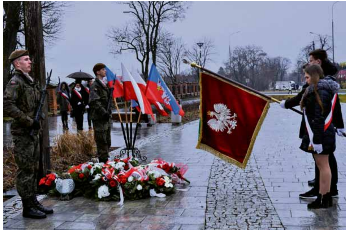
Złożenie kwiatów przy krzyżu na Placu Powstań Narodowych w Łęcznej.