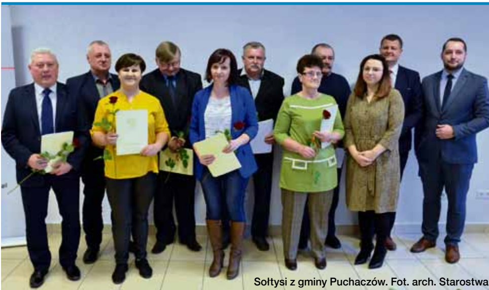
Sołtysi z gminy Puchaczów.