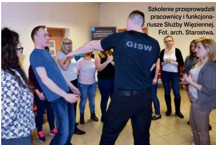
Szkolenie przeprowadzili pracownicy i funkcjonariusze Służby Więziennej.

Szkolenie prowadzone było przez lubelskich funkcjonariuszy i pracowników Służby Więziennej w związku z Kampanią Społeczną Służby Więziennej o takiej samej nazwie. Funkcjonariusze Grupy Interwencyjnej Służby Więziennej przy OISW w Lublinie przeprowadzili zajęcia praktyczne z zasad samoobrony, technik interwencji oraz zasad udzielania pierwszej pomocy przedmedycznej. Psycholog z Aresztu Śledczego w Lublinie zrealizował warsztaty dotyczące poznania metod komunikacji i rozwiązywania sytuacji konfliktowych, wynikających z kontak-