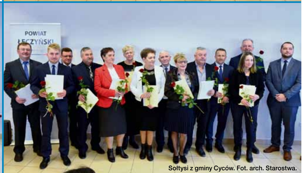
Sołtysi z gminy Cyców.