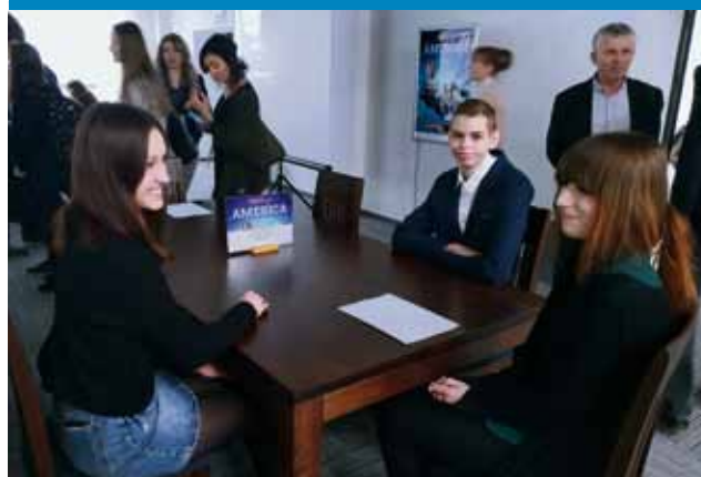
„Faces of America” – 6 marca

Uczniowie „Bolivara” zajęli VI miejsce w dwuetapowym konkursie językowym, organizowanym przez UMCS w Lublinie. Młodzież miała za zadanie napisać esej na temat: „New York – love it or hate it” oraz rozwiązać quiz kulturowy o USA.