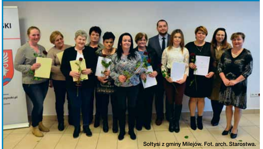
Sołtysi z gminy Milejów.