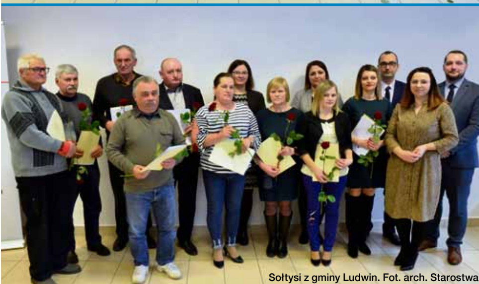
Sołtysi z gminy Ludwin.