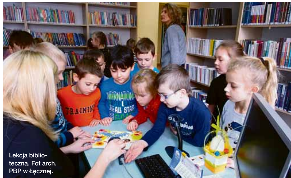
Lekcja biblioteczna.