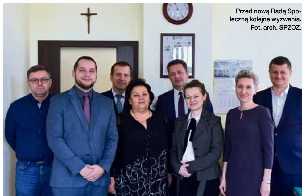
Przed nową Radą Społeczną kolejne wyzwania.