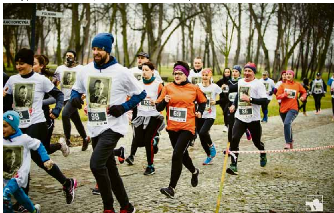
„Bieg Tropem Wilczym” zorganizowany został przez Stowarzyszenie „Patria”, Patriotyczną Łęczną „NL” oraz Urząd Miejski w Łęcznej.