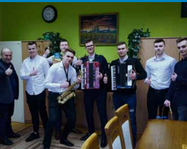
Z życzeniami pomyślności dla wszystkich Pań od Zespołu Szkół Górniczych! – 9 marca

Uczniowie ZSG w Łęcznej wyruszyli z muzycznymi życzeniami do dziewcząt i pań ze Szkoły Podstawowej nr 4 i Szkoły Podstawowej nr 2 w Łęcznej. Uśmiech na twarzach dam był bezcenną nagrodą za ten jakże miły gest.