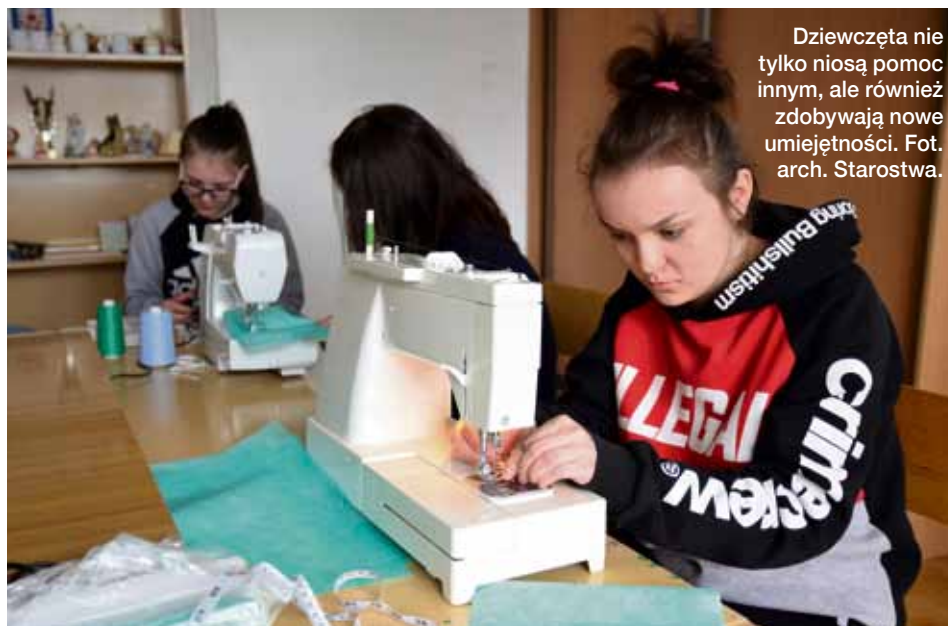
Dziewczęta nie tylko niosą pomoc innym, ale również zdobywają nowe umiejętności.