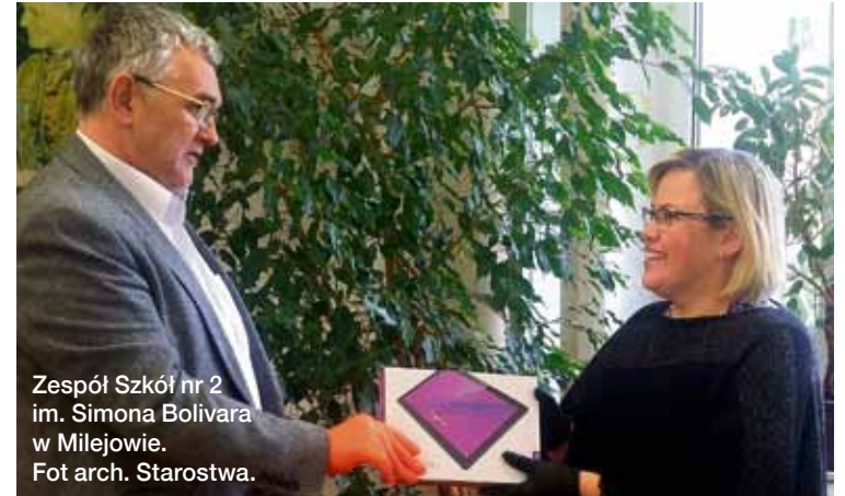
Zespół Szkół nr 2 im. Simona Bolívara w Milejowie.