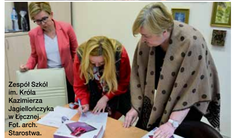
Zespół Szkół im. Króla Kazimierza Jagiellończyka w Łęcznej.