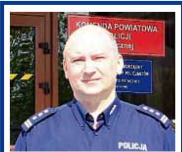
insp. Paweł Paździor, Komendant Powiatowy Policji w Łęcznej.

staci zmniejszenia (od 5 do 25%), a w skrajnych przypadkach nawet odebrania wszystkich rodzajów dopłat bezpośrednich za dany rok.