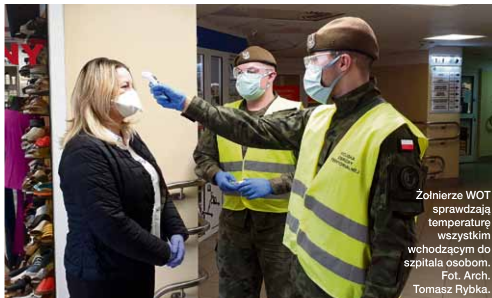
Żołnierze WOT sprawdzają temperaturę wszystkim wchodzącym do szpitala osobom.