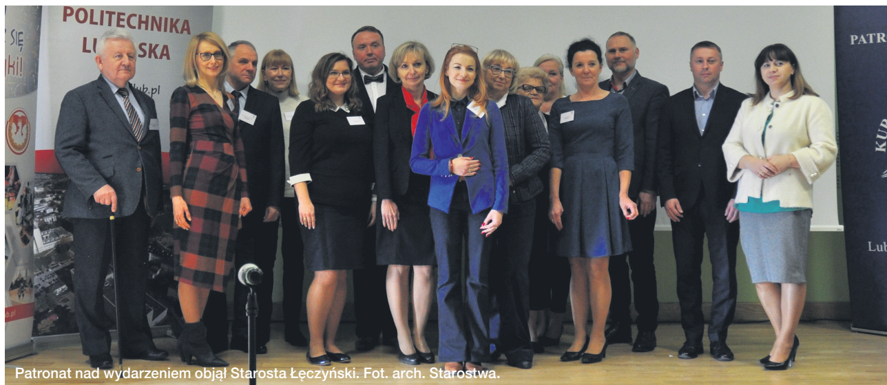
Patronat nad wydarzeniem objął Starosta Łęczyński.