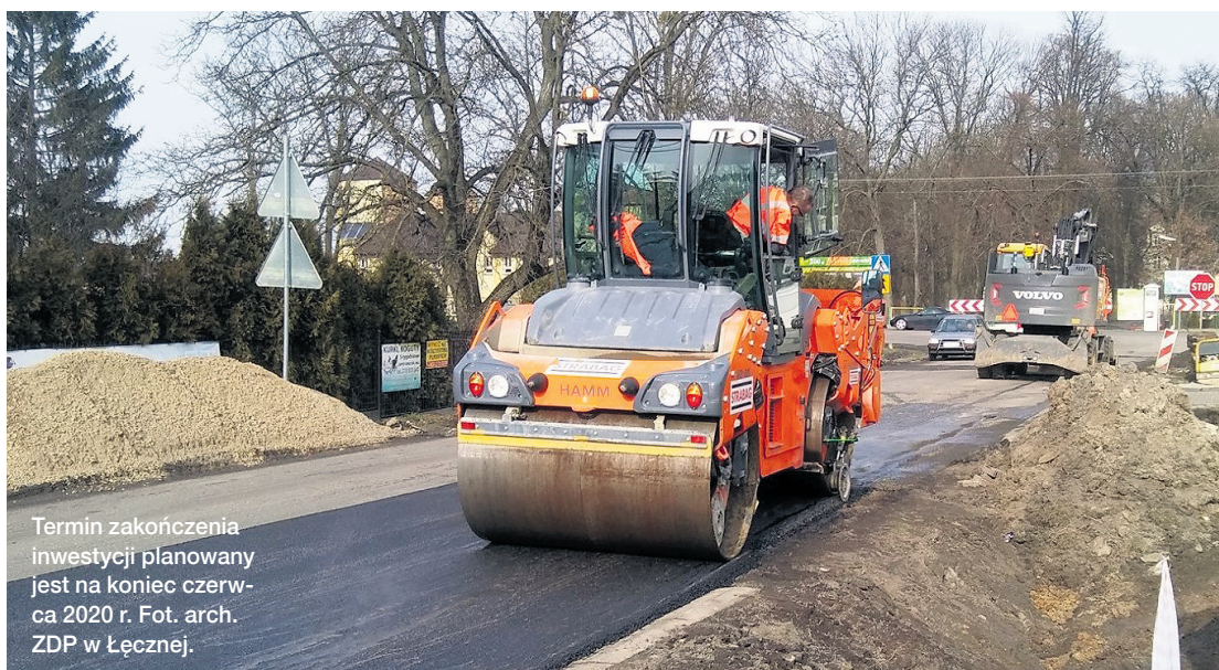
Termin zakończenia inwestycji planowany jest na koniec czerwca 2020 r.