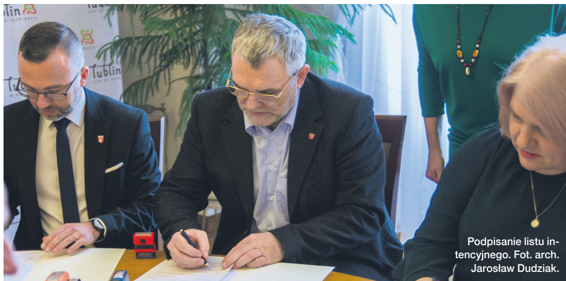
Podpisanie listu intencyjnego.

Przedstawiciele powiatu łęczyńskiego znaleźli się wśród 21 sygnatariuszy (gmin i powiatów) listu intencyjnego, dotyczącego współpracy na rzecz rozwoju Lubelskiego Obszaru Metropolitalnego.