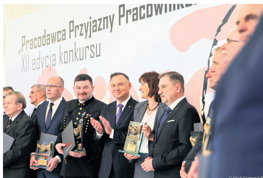
Wręczenie nagród odbyło się w Sali Kolumnowej Pałacu Prezydenckiego.

Chciałbym serdecznie podziękować za to wyróżnienie, które potwierdza, że należy do grupy polskich pracodawców, którzy w szczególnym szacunkiem podchodzą do tematu praw pracowników oraz prowadzą aktywne dialog ze stroną społeczną. Jesteśmy jednym z największych pracodawców na Lubelszczyźnie. Zatrud-