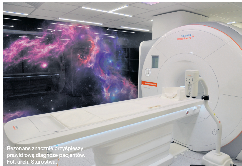
Rezonans znacznie przyspieszy prawidłową diagnozę pacjentów.