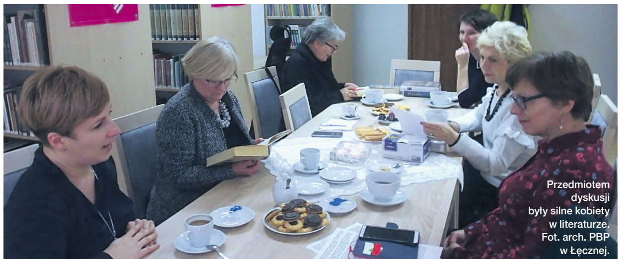
Przedmiotem dyskusji były silne kobiety w literaturze.