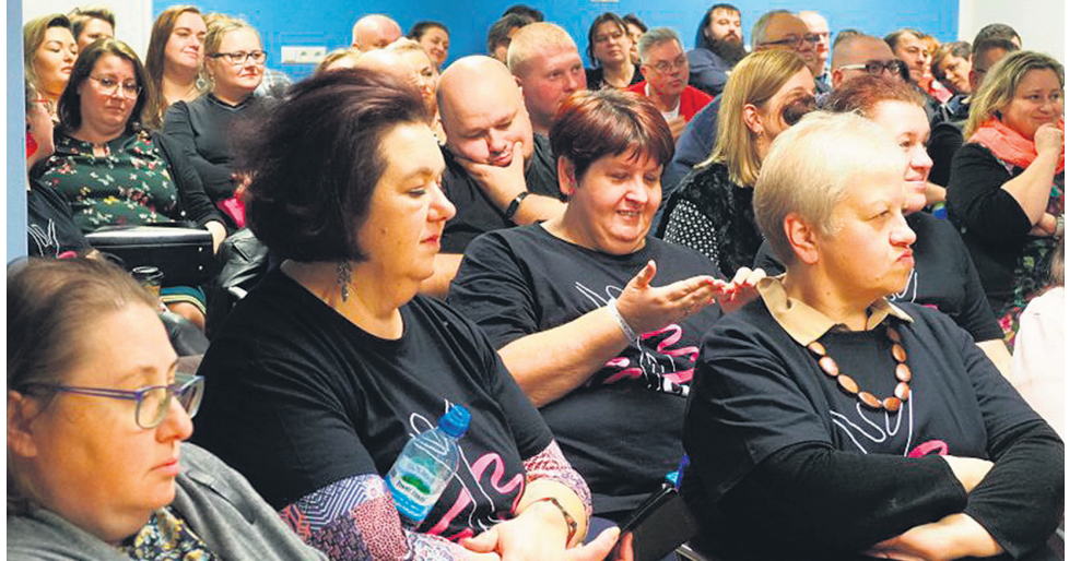
Grupa Wsparcia Pacjentów Bariatrycznych Chirurgicznego Leczenia Otyłości funkcjonuje już od roku.