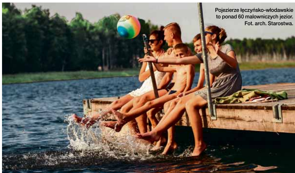
Pojezierze łęczyńsko-włodawskie to ponad 60 malowniczych jezior.

Za najważniejsze działania z zakresu turystyki należy uznać, m.in. utworzenie w 2006 r. powiatowego punktu informacji turystycznej oraz uruchomienie, cztery lata później, turystycznego portalu Pojezierza Łęczyńsko-Włodawskiego. Rok 2010 i 2011 obfitowały w nagrody. I tak, otrzymaliśmy wyróżnienie i nagrodę internautów dla szlaku turystycznego „Magia Miejsc” w konkursie Najlepszy Produkt Turystyczny Województwa Lubelskiego 2010 oraz nagrodę „Kryształowa Elka” w kategorii „Strona internetowa” za stronę www.turystyka-pojezierze.pl , która była pierwszym – i jest jedynym do tej pory – portalem