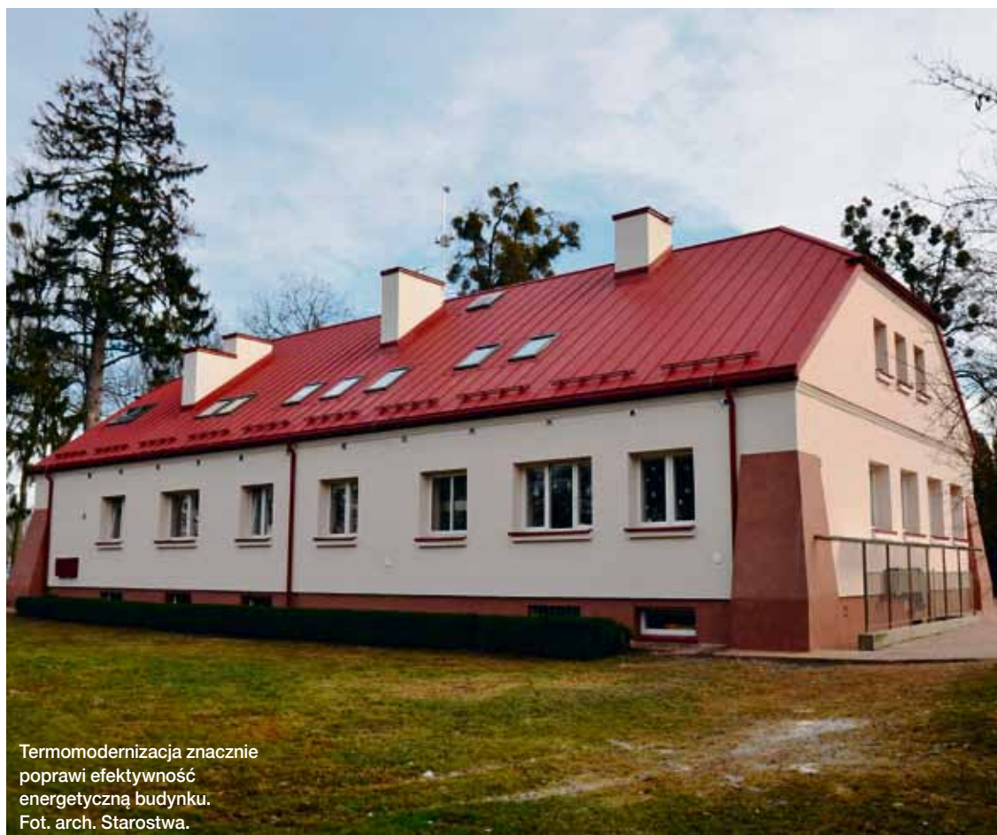
Termomodernizacja znacznie poprawi efektywność energetyczną budynku.