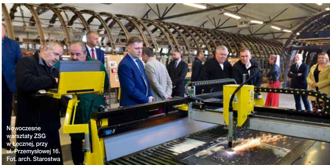
Nowoczesne warsztaty ZSG w Łęcznej, przy ul. Przemysłowej 16.

Utworzenie Otwartych Stref Aktywności Fizycznej w ZS nr 2 im. S. Bolívara w Milejowie i ZSR w Kijanach.