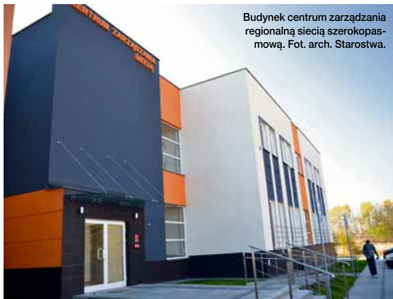
Budynek centrum zarządzania regionalną siecią szerokopasmową.