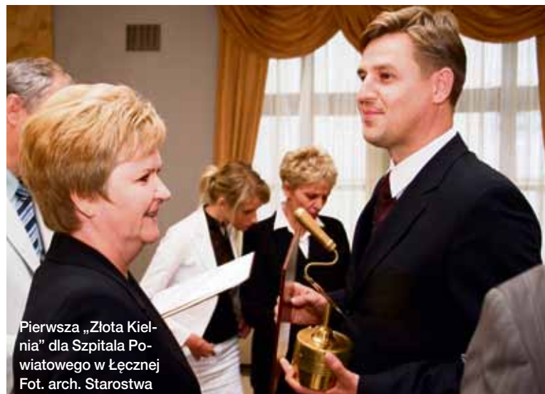
Pierwsza „Złota Kielnia” dla Szpitala Powiatowego w Łęcznej