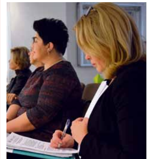
Uczestnicy spotkania.