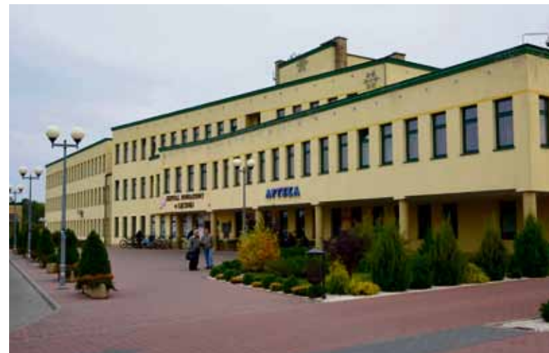
Szpital Powiatowy w Łęcznej.

Pierwszoplanowym celem programu jest wykrycie zmian nowotworowych we wczesnej fazie rozwoju choroby, co daje większą szansę terapii zakończonej pełnym wyleczeniem. Realizacja ww. programu to zaangażowanie i wkład naszego samorządu w promocję profilaktyki oraz wczesnego wykrywania chorób onkologicznych i stanowi dowód troski o najmłodszych mieszkańców naszego powiatu.