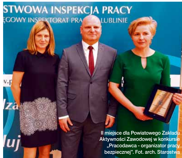
II miejsce dla Powiatowego Zakładu Aktywności Zawodowej w konkursie „Pracodawca - organizator pracy bezpiecznej”.