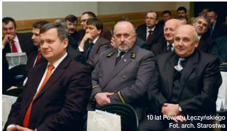
10 lat Powiatu Łęczyńskiego