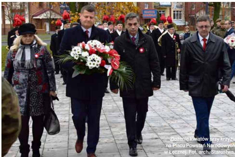
Złożenie kwiatów przy krzyżu na Placu Powstań Narodowych w Łęcznej.

Tekst: Justyna Słomka Plac Powstań Narodowych zapelnili licznie przybyli mieszkańcy powiatu.