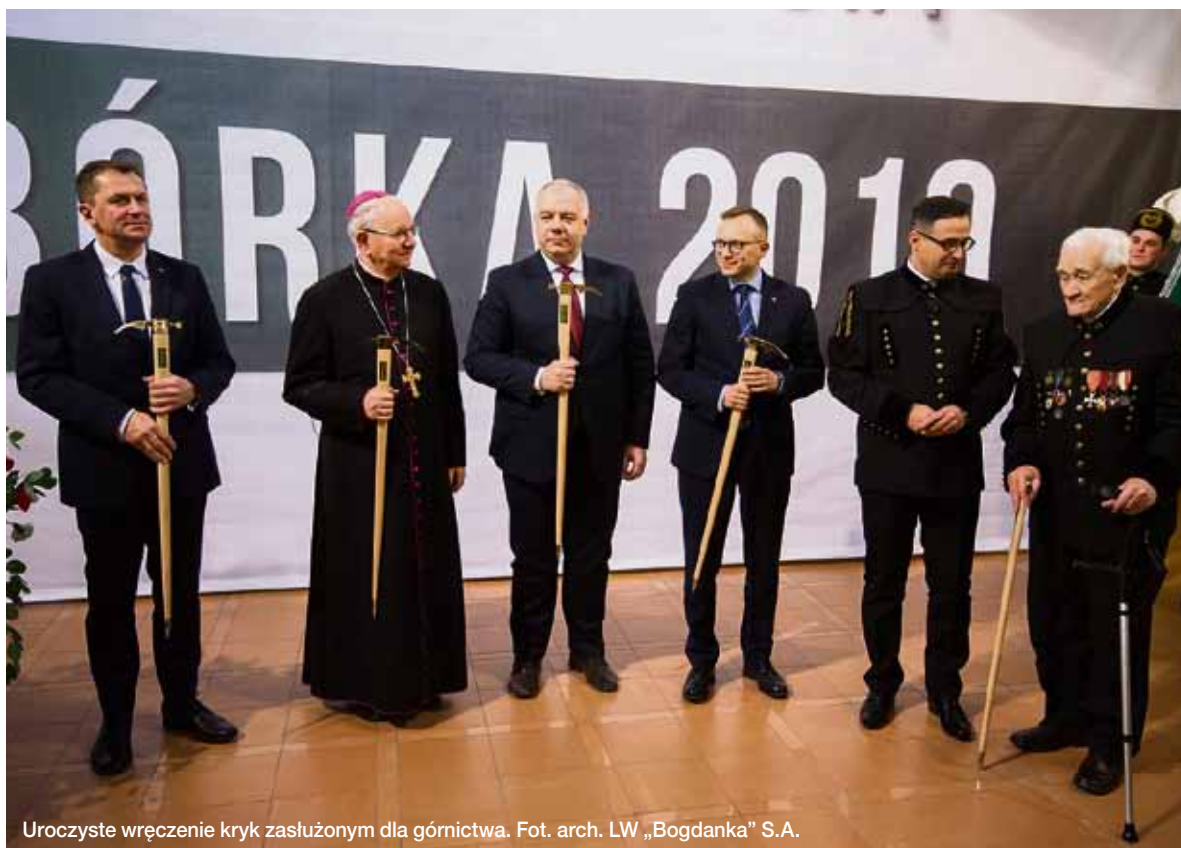
Uroczyste wręczenie kryk zasłużonym dla górnictwa.