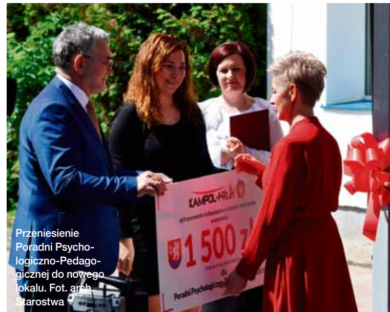
Przeniesienie Poradni Psychologiczno-Pedagogicznej do nowego lokalu.