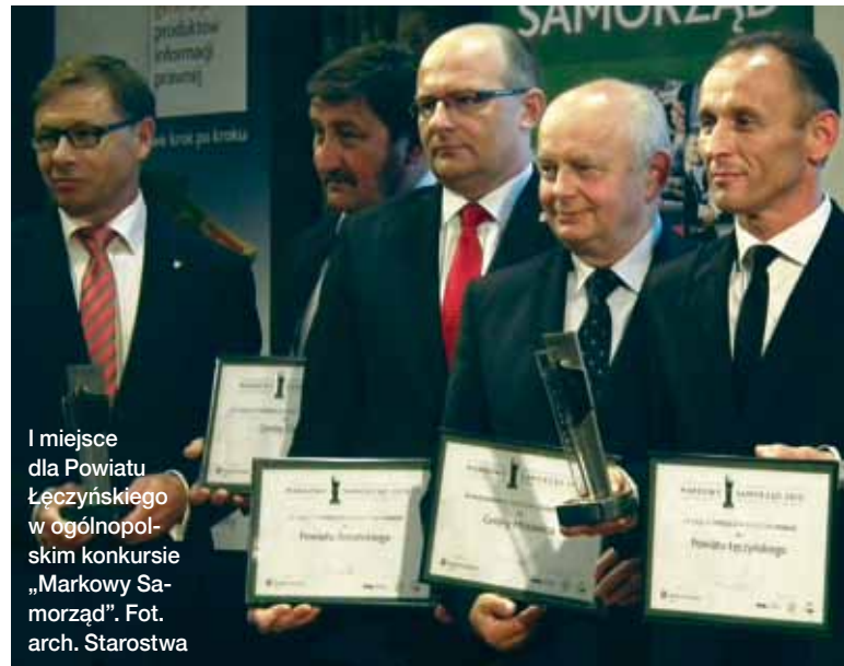
I miejsce dla Powiatu Łęczyńskiego w ogólnopolskim konkursie „Markowy Samorząd”.