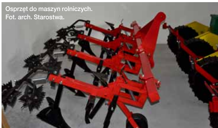
Osprzęt do maszyn rolniczych.

kształcenia zawodowego i ustawicznego. Zadanie współfinansowane ze środków Unii Europejskiej