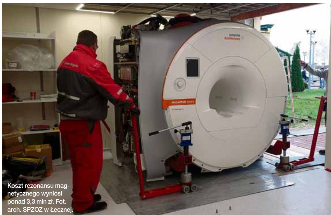
Koszt rezonansu magnetycznego wyniósł ponad 3,3 mln zł.