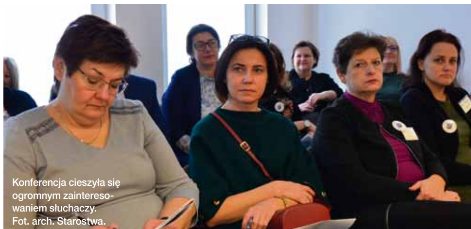
Konferencja cieszyła się ogromnym zainteresowaniem słuchaczy.

W sali konferencyjnej Starostwa Powiatowego w Łęcznej w dniu 29 listopada br. odbyła się kolejna wojewódzka konferencja przygotowana przez Poradnię Psychologiczno-Pedagogiczną w Łęcznej. Tematem spotkania było zdrowie psychiczne dzieci i młodzieży.