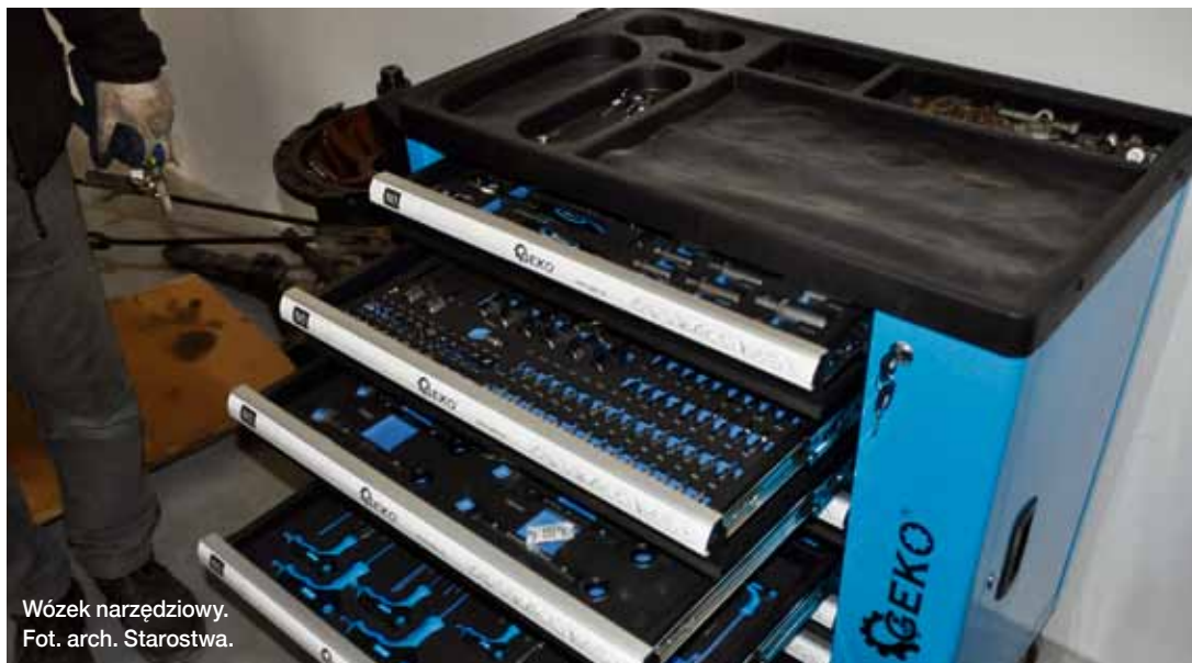
Wózek narzędziowy.

Dzięki zakończonemu projektowi, baza lokalowa szkoły uległa poprawie. Wyremontowano i wyposażono w nowe maszyny i urządzenia: pracownię gastronomiczną (lodówki, kuchenki elektryczne z okapami, meble kuchenne, stoły metalowe, zastawy stołowe), dwie pracownie informatyczne, pracownię spawalniczą (trzy kompletne stanowiska spawalnicze) oraz ww. pracownię