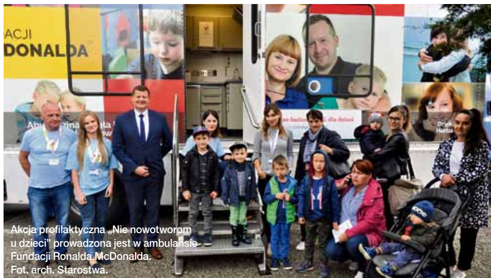
Akcja profilaktyczna „Nie nowotworom u dzieci” prowadzona jest w ambulansie Fundacji Ronald McDonalda.