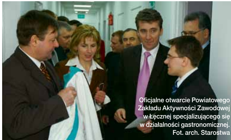
Oficjalne otwarcie Powiatowego Zakładu Aktywności Zawodowej w Łęcznej specjalizującego się w działalności gastronomicznej.