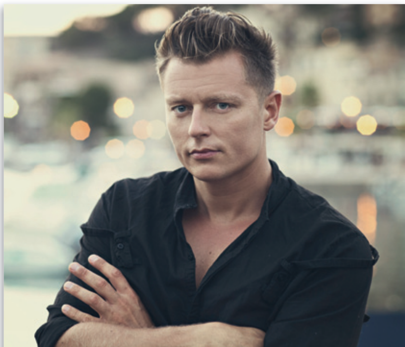
Gwiazda wieczoru – Rafał Brzozowski