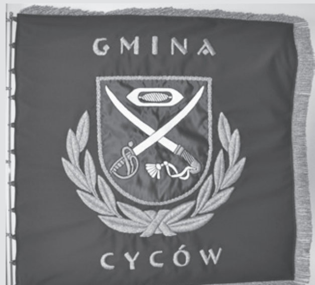
Sztandar Gminy Cyców.