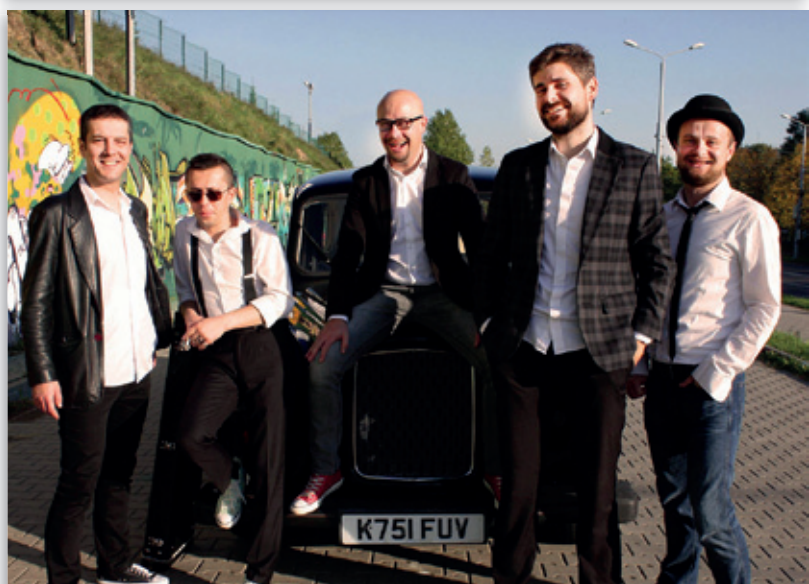
Rock'n'roll z zespołem Backbeat