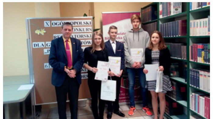
Ogólnopolski Konkurs Recytatorski – eliminacje powiatowe.