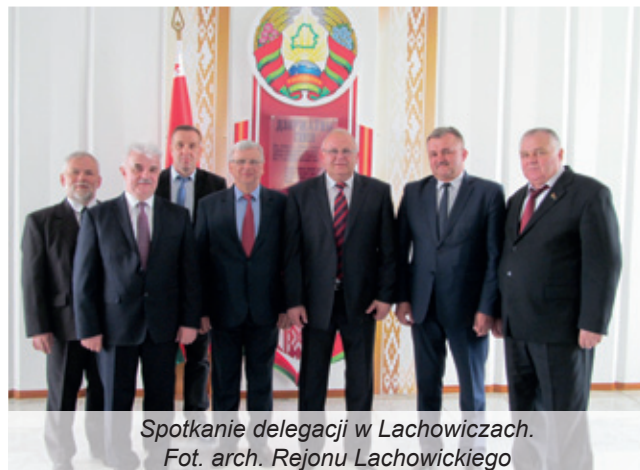
Spotkanie delegacji w Lachowiczach.