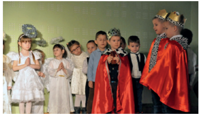
Festiwal Teatralny „Hej kolęda, kolęda”.