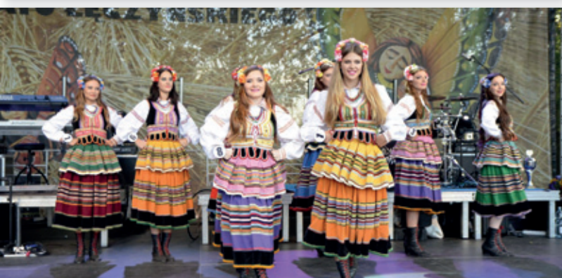
Wybory Miss Dożynek