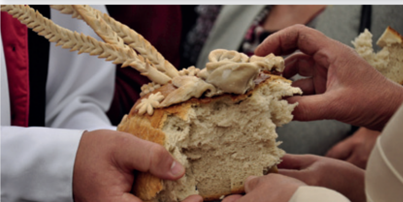
Wspólne dzielenie chlebem