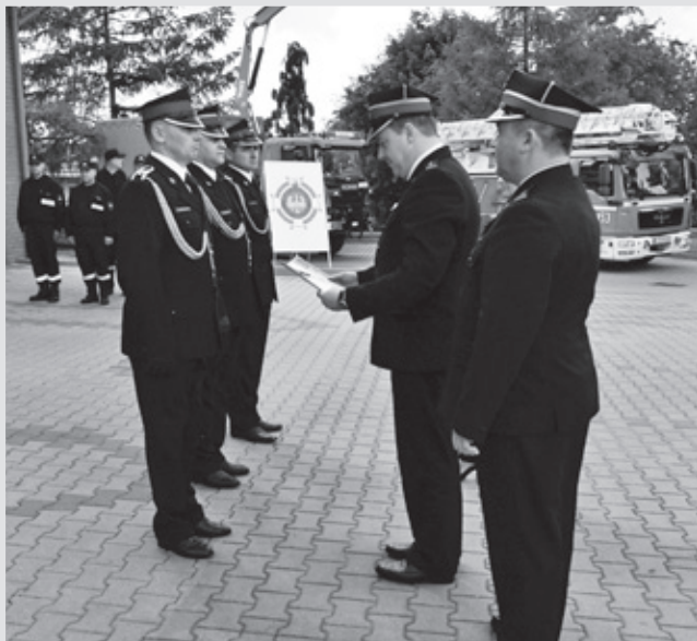
Uroczysty apel przed KPPSP w Łęcznej.