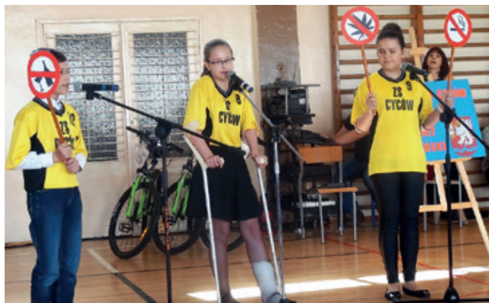
Konkurs Wiedzy Prewencyjnej „Jestem Bezpieczny”.