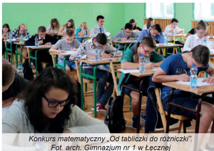
Konkurs matematyczny „Od tabliczki do różniczki”.