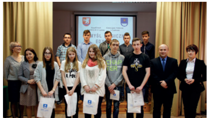
Konkurs matematyczny „Pomyśl logicznie”.