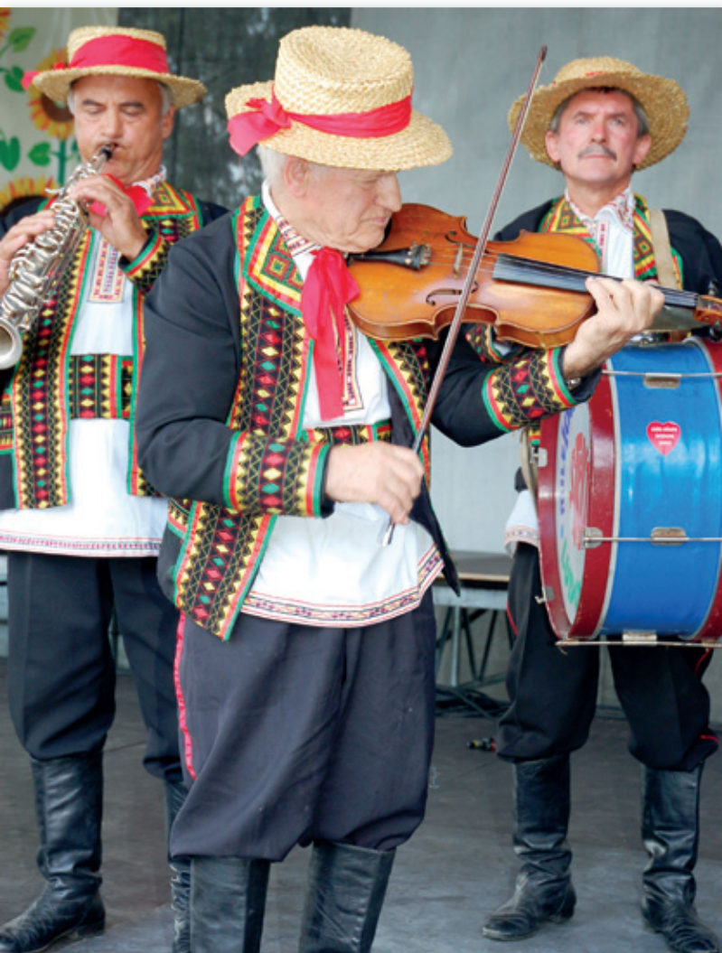
Prezentacja lokalnych zwyczajów i kultury ludowej