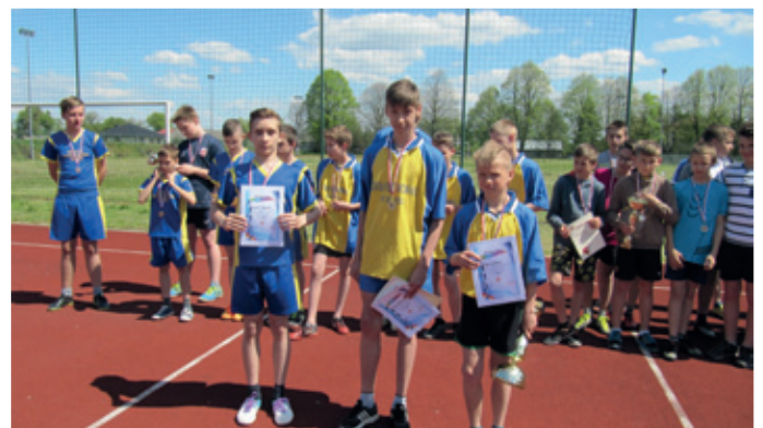
Powiatowe zawody w czwórboju lekkoatletycznym.