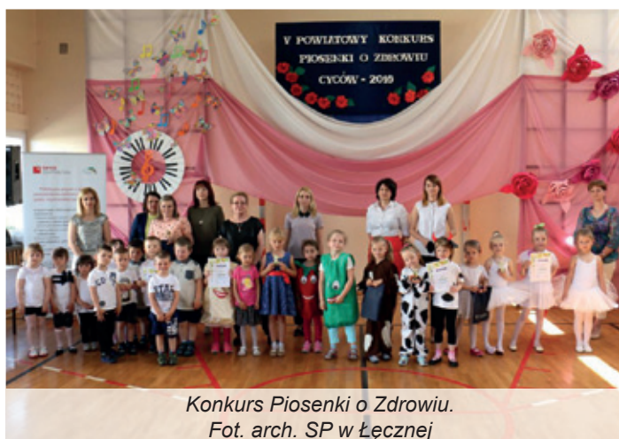
Konkurs Piosenki o Zdrowiu.