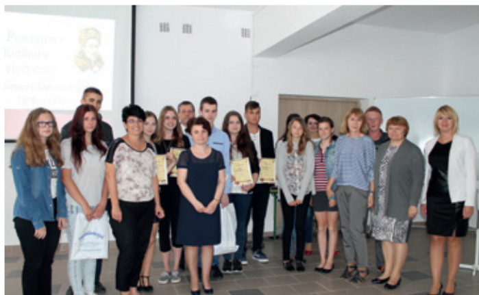
Konkurs historyczny „Kazimierz Jagiellończyk i jego czasy”.