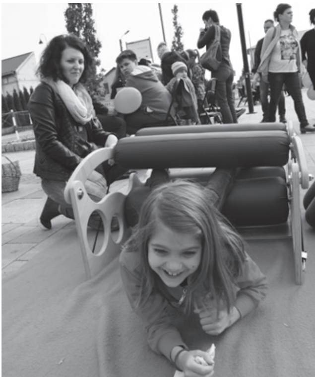
Najmłodsi uczestnicy obchodów „Dnia Autyzmu”.

Tekst: Aneta Zabłocka, Małgorzata Zarzycka