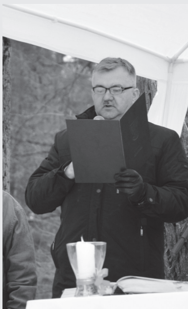
Okolicznościowe przemówienie Starosty