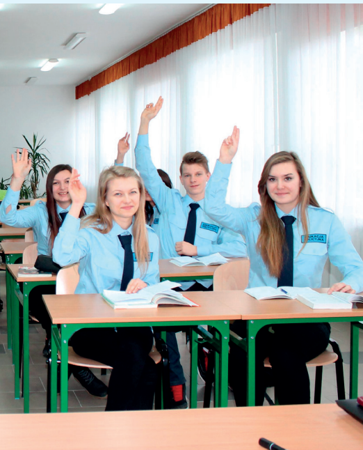
Klasa policyjna w I LO im. J. Zamoyskiego w „Jagiellończyku”