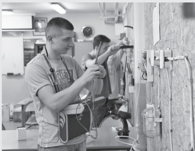
Technikum Elektryczne Zespołu Szkół Górniczych w Łęcznej w czołówce najlepszych techników woj. lubelskiego w rankingu Wydawnictwa „Perspektywy”.