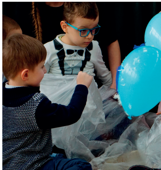
Mali wychowankowie poradni