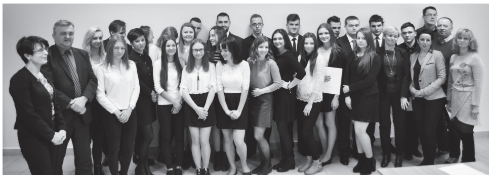
Pamiętkowe zdjęcie uczestników uroczystości wręczenia listów gratulacyjnych stypendystom i ich rodzicom.