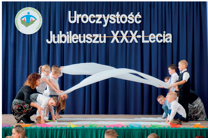
Występy dzieci podczas Jubileuszu XXX-lecia Poradni.