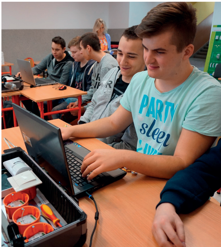
Elektrycy z ZSG w Łęcznej podczas warsztatów certyfikujących - System Inteligentnego Budynku F&Home Radio.

Elektryk może pracować jako samodzielny specjalista lub elektryk zakładowy. Zapotrzebowanie na elektryków wciąż rośnie, mają więc oni szansę na dobre zarobki. Technik chłodnictwa i klimatyzacji to zawód poszukiwany na rynku pracy. Branża chłodnicza i klimatyzacyjna rozwijają się jak nigdy dotąd i potrzebuje coraz więcej wykwalifikowanych specjalistów. Nowością w ofercie szkoły jest klasa sportowa pod patronatem GKS Górnik Łęczna . Uczeń klasy sportowej ma możliwość uczestniczenia w zawodach, obozach i zgrupowaniach sportowych, a jednocześnie zdobycia zawodu, który po ukończeniu kariery sportowej pozwala mu wejść na rynek pracy.