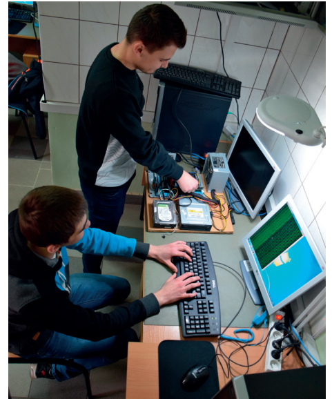
Informatyk, to zawód poszukiwany na rynku pracy.

Informatyk to zawód dający duże możliwości na lubelskim rynku pracy. Kształcenie w tym zawodzie przygotowuje do pracy m.in. jako: administrator sieci komputerowych, obsługa informatyczna przedsiębiorstwa, programista, serwisant komputerowy, sprzedawca w sklepach komputerowych. Warto zwrócić uwagę na klasę wojskową w LO , której ukończenie będzie premiowało w rekrutacji do wojsk obrony terytorialnej i do uczelni wojskowych. Krawiec to zawód pozwalający na prowadzenie własnej pracowni lub pracę w firmach odzieżowych.