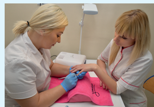
Nauka zawodu w pracowni kosmetycznej