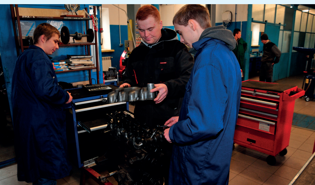
Pracownia do nauki zawodów mechanik pojazdów samochodowych i technik mechanizacji rolnictwa