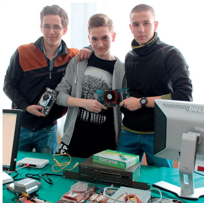
Uczniowie kierunku technik informatyk łatwo znajdują pracę.

I LO im. Jana Zamoyskiego ma w wyborze aż 4 języki obce i wiele rozszerzeń. W nowej siedzibie, pod nowym szyldem uczą nauczyciele z pasją, którzy gwarantują wysoką zdawalność matur i sukcesy w wielu dziedzinach. Technik ekonomista i technik informatyk to kierunki, w których uczniowie podejmują pracę już w IV klasie Technikum. Na nowym kierunku – technik logistyk uczniowie zdobędą na m.in. wiedzę i umiejętności z planowania i wdrażania procesów przechowywania i transportowania produktów, zarządzania zapasami i przestrzenią magazynową, tworzenia planów dostaw, prowadzenia rozliczeń ze sprzedawcami i klientami, organizowania przewozów osób w komunikacji publicznej i opracowywania rozkładów jazdy.