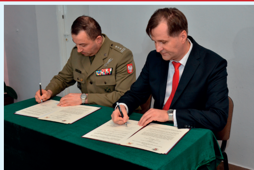
W milejowskim LO utworzono klasę wojskową