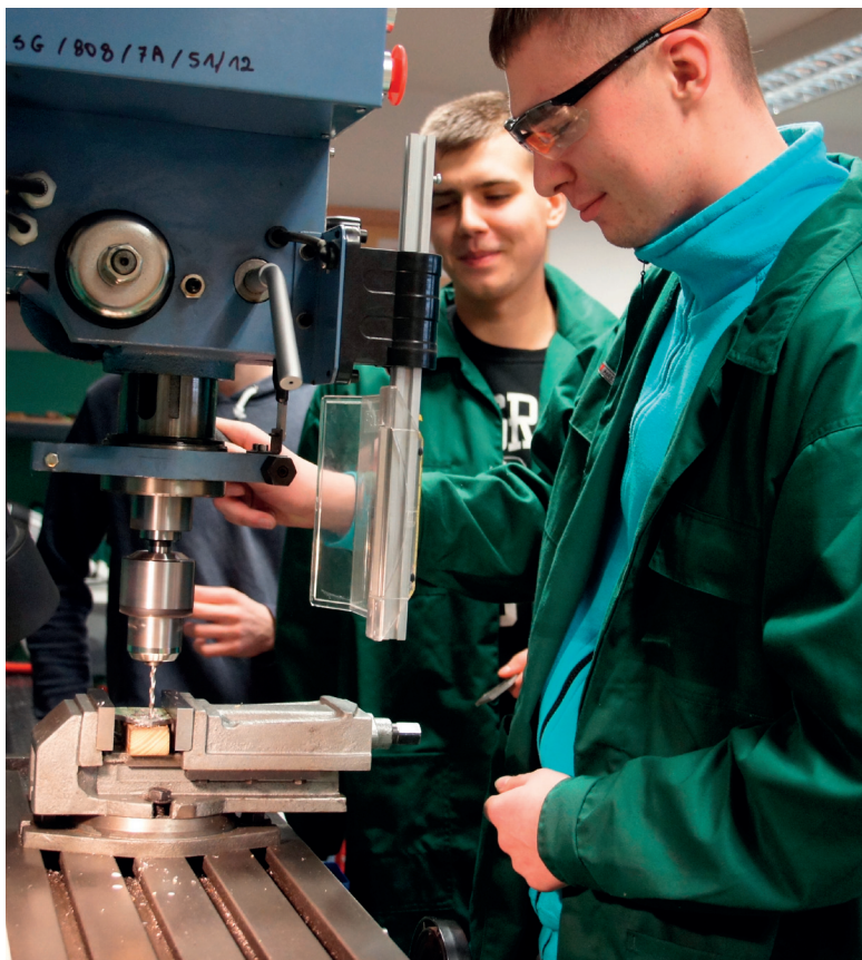
Zajęcia w pracowni mechanicznej ZSG w Łęcznej.