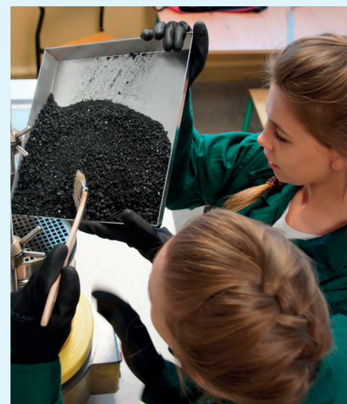
Pracownia przeróbki w ZSG