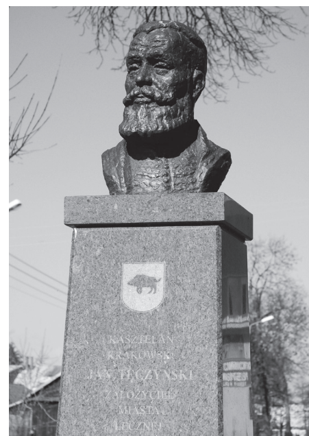
Jan Tęczyński – założyciel miasta Łęczna.