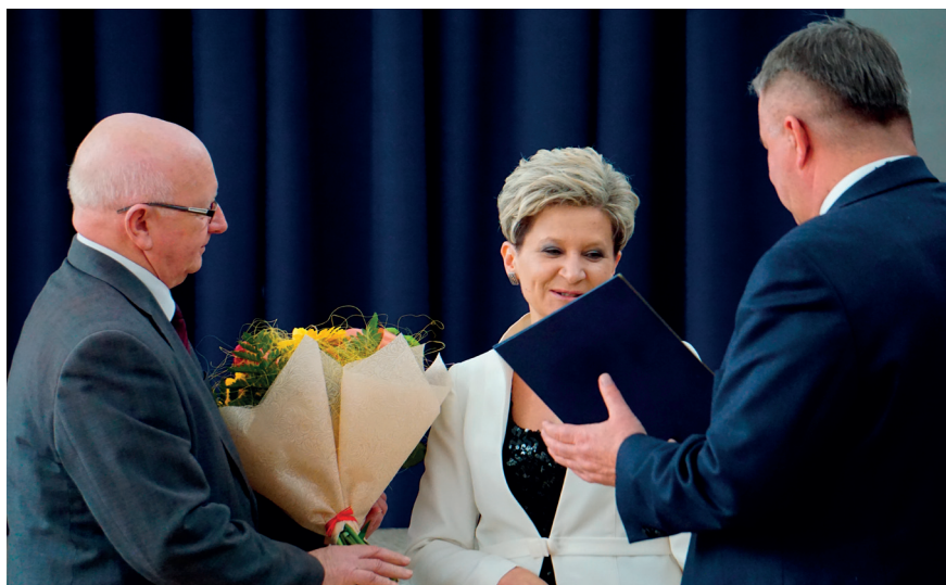
Przewodniczący Rady Powiatu i Starosta składają okolicznościowe życzenia