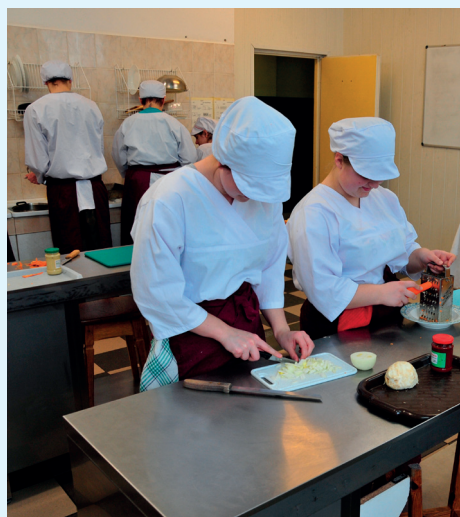
ZSR w Kijanach kształci w zawodzie technik żywienia i usług gastronomicznych.