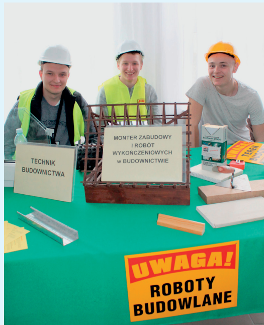
„Jagiellończyk” kształci specjalistów w budownictwie