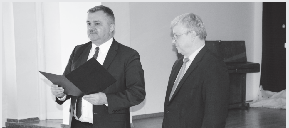
Starosta Łęczyński i Wójt Gminy Puchaczów podczas uroczystości oficjalnego otwarcia pomiaru prędkości.