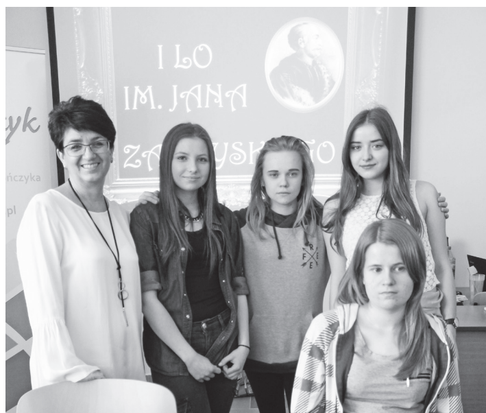
Z dniem 01.09.2019 r. I LO im. J. Zamoyskiego w ZS im. Króla K. Jagiellończyka w Łęcznej z 3-letniego zostanie przekształcone w 4-letnie.

W związku z wejściem w życie przepisów wprowadzających ustawę – Prawo oświatowe Rada Powiatu w Łęcznej podjęła uchwałę w sprawie dostosowania sieci publicznych szkół ponadgimnazjalnych i specjalnych do nowego ustroju szkolnego. W tym celu podjęto następujące kroki: