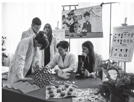
Dzień Otwarty w „Jagiellończyku”.