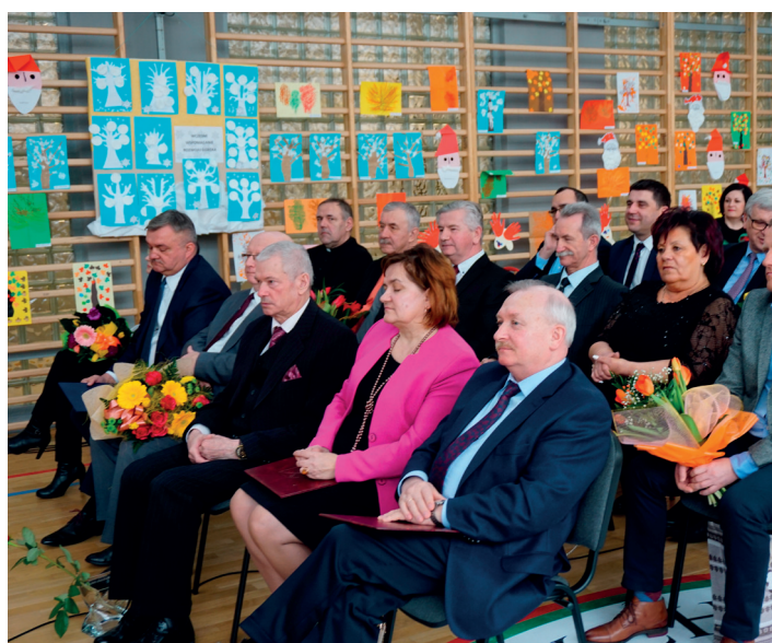
Uroczystość zgromadziła liczne grono uczestników