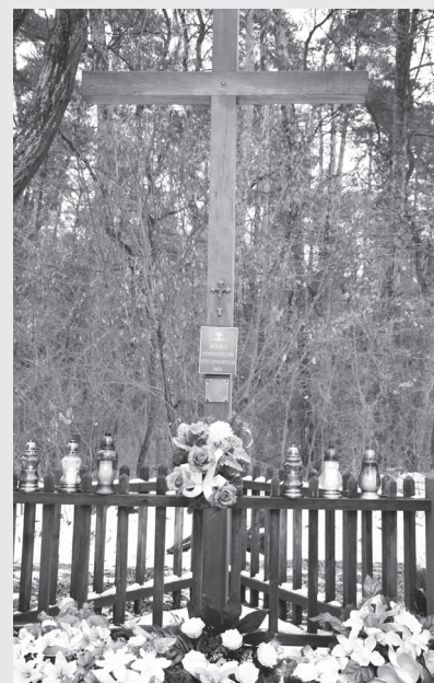
Mogila powstańców w Klarowie