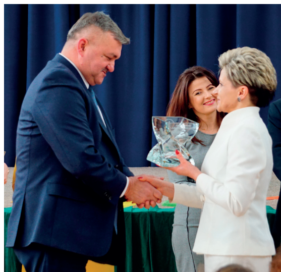
Starosta uhonorowany tytułem i statuetką „Przyjaciół Poradni”