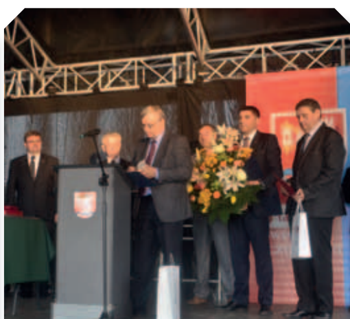
Życzenia urodzinowe od przedstawicieli gmin powiatu łęczyńskiego