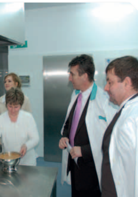
Otwarcie Powiatowego Zakładu Aktywności Zawodowej – 2007 r.