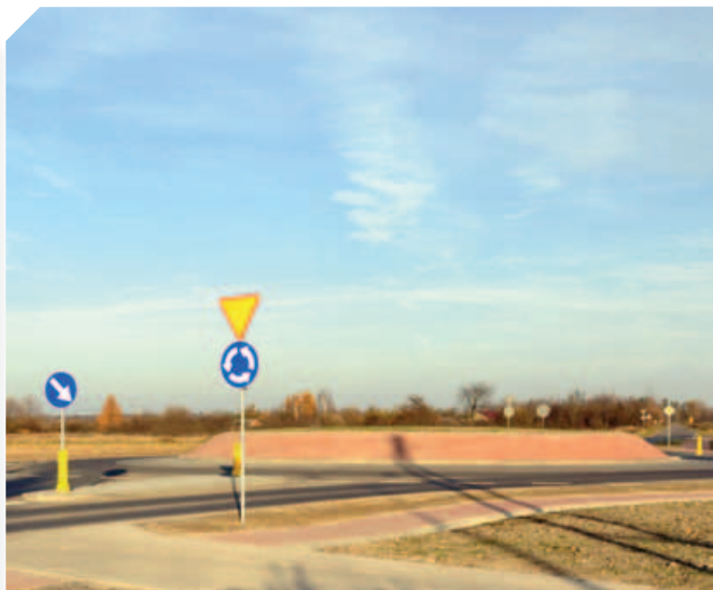
Rondo w Nadrybiu