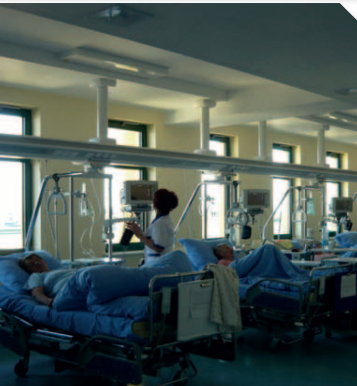
OIK w Szpitalu Powiatowym w Łęcznej