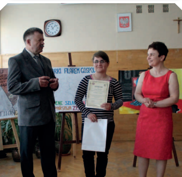
Konkurs „Kazimierz Jagiellończyk i jego czasy” w ZS im. Króla K. Jagiellończyka w Łęcznej