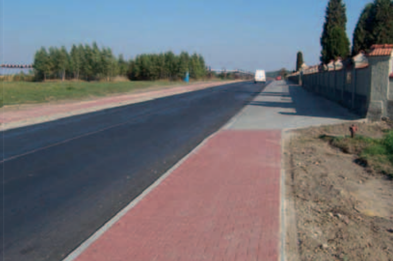
Droga powiatowa w Puchaczowie