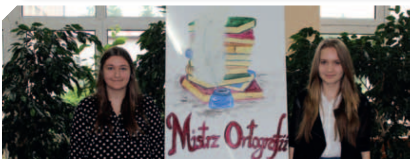
Konkurs „Mistrz Ortografii Powiatu Łęczyńskiego” w Gimnazjum nr 1 w Łęcznej