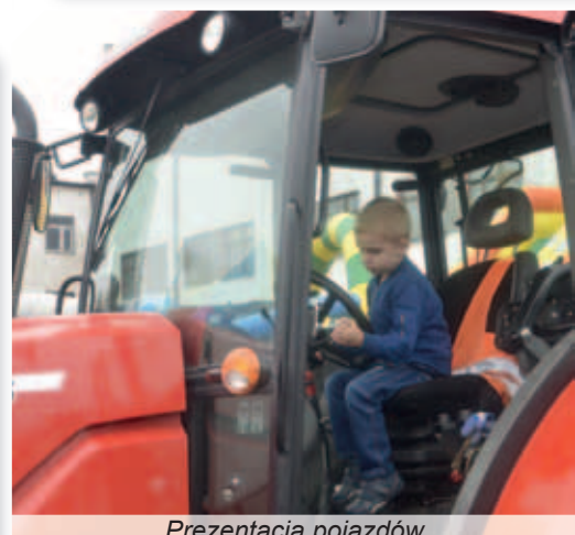
Prezentacja pojazdów Zarządu Dróg Powiatowych