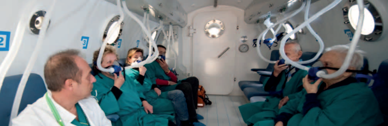
Komora hiperbaryczna we Wschodnim Centrum Leczenia Oparzeń