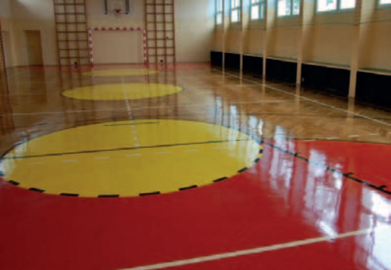
Sala gimnastyczna w ZS nr 2 w Milejowie