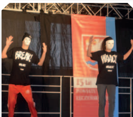
Pokazy tańca nowoczesnego