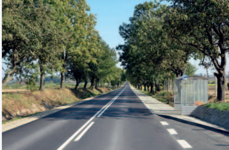
Droga Łuszczów - Kijany