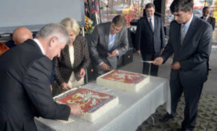
Wspólne dzielenie urodzinowego tortu