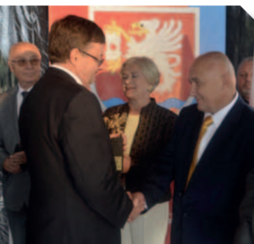
Uroczyste wręczenie statuetek Gryfa