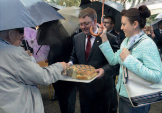
Obrzęd dzielenia chlebem