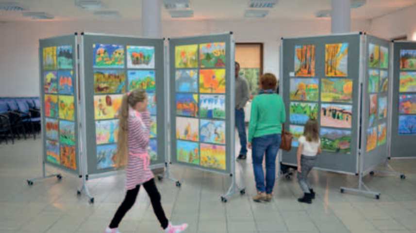
Konkurs „W barwach jesieni - a w górach już jesień” w Cycowie