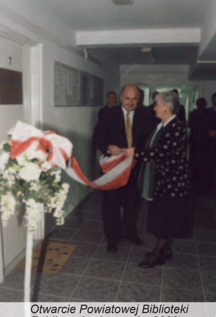
Otwarcie Powiatowej Biblioteki Publicznej w Łęcznej – 2000 r.