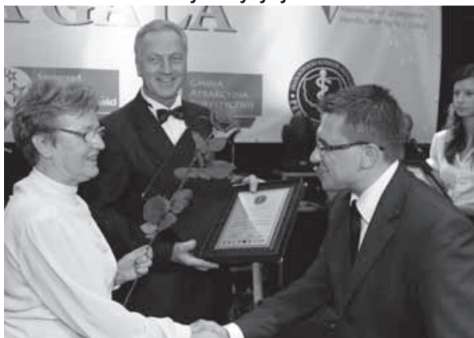
Perły Medycyny 2011