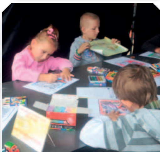
Konkurs plastyczny dla dzieci