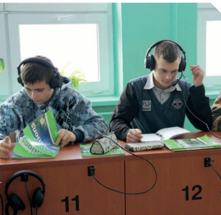
Pracownia językowa w Zespole Szkół Górniczych w Łęcznej