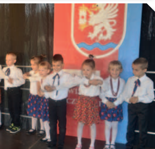
Występy artystyczne najmłodszych