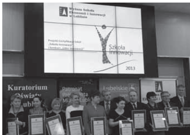
Szkoła Innowacji 2013