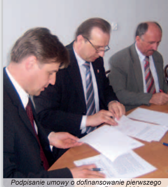
Podpisanie umowy o dofinansowanie pierwszego projektu z Euroregionem Bug – 2006 r.