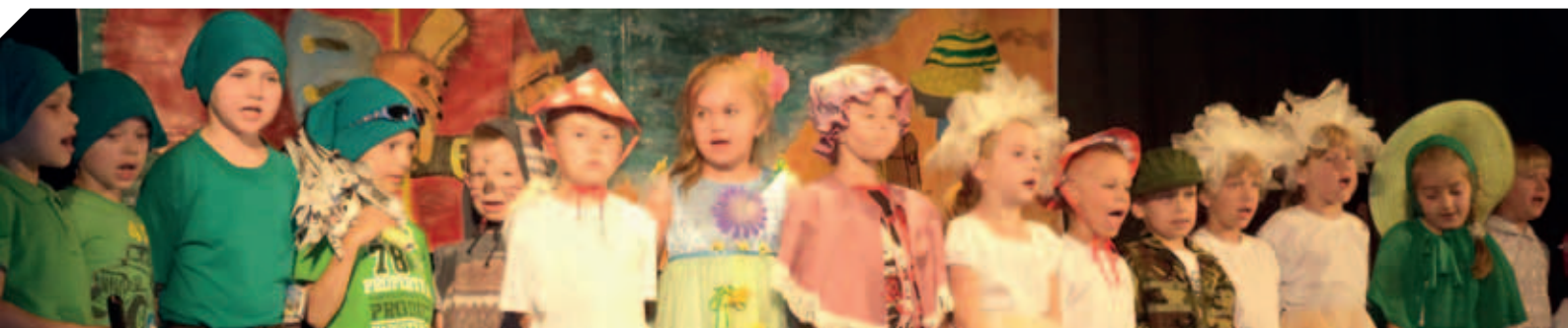
Powiatowy Przegląd Teatrzyków Dziecięcych w GOK w Milejowie