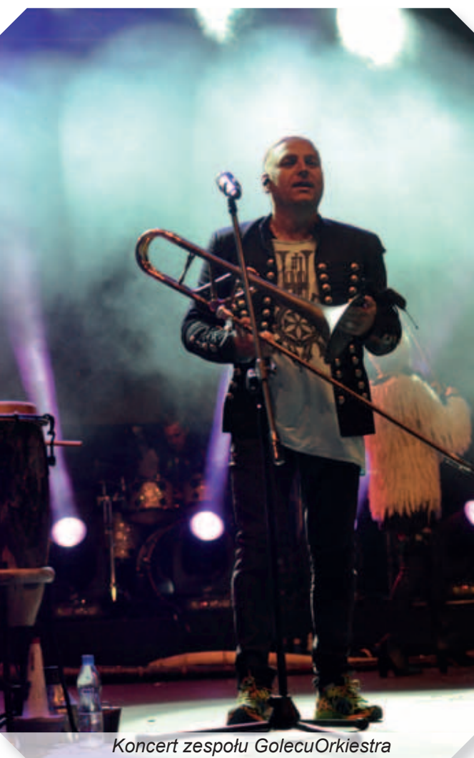
Koncert zespołu GolecuOrkiestra