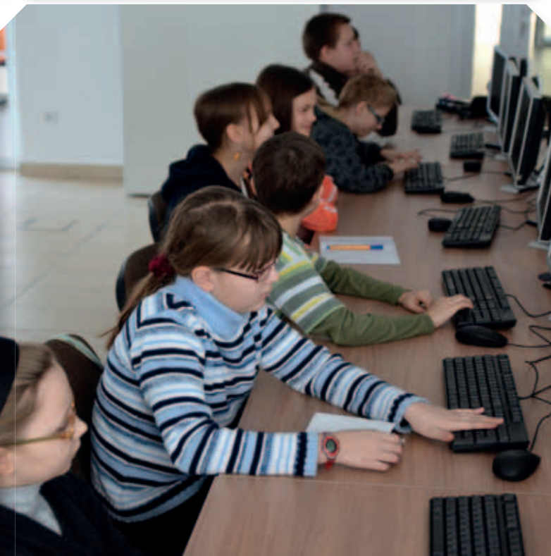
Telecentrum w Centrum Zarządzania Siecią