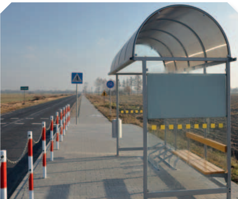
Ścieżka rowerowa w Kaniwoli