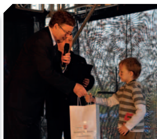
Wręczenie nagród laureatom konkursu plastycznego