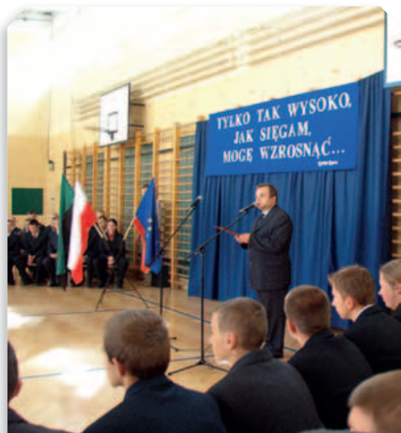
Otwarcie Technikum Górniczego w Łęcznej – 2005 r.