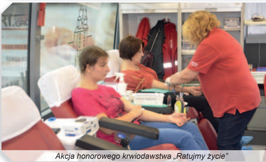
Akcja honorowego krwiodawstwa „Ratujmy życie”