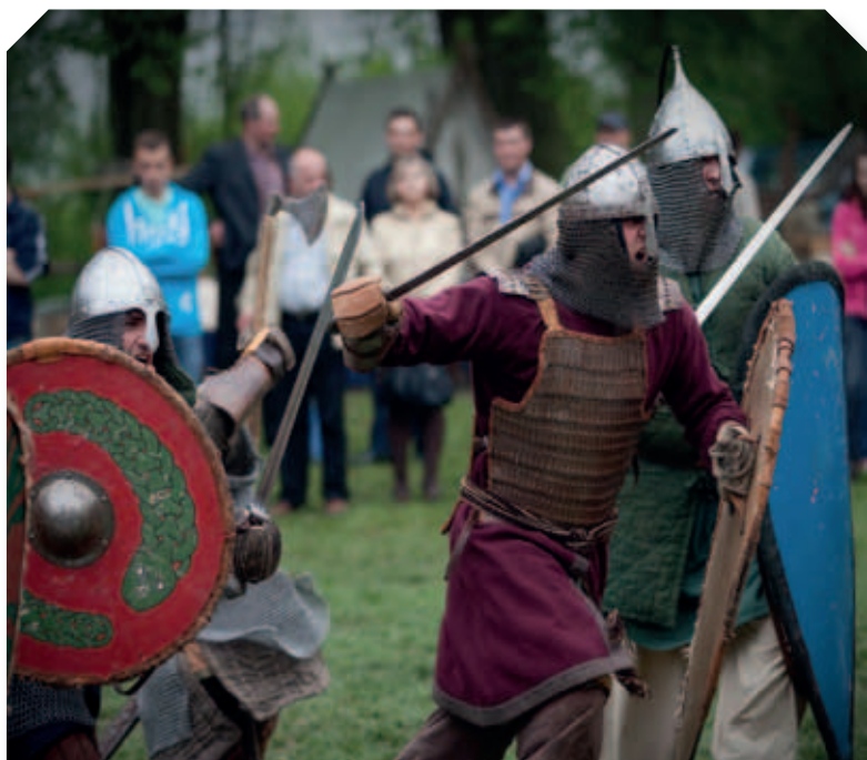
Historyczna Majówka w Zawieprzycach