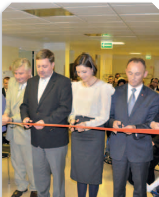
Otwarcie Ośrodka Rewalidacyjno-Wychowawczego – 2011 r.