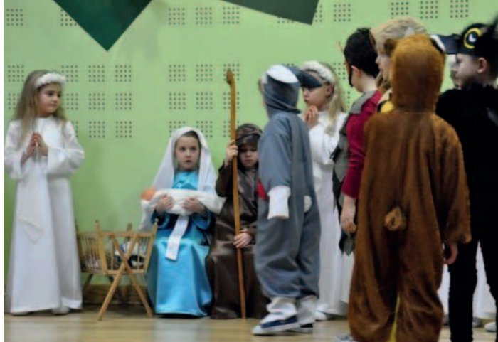
Festiwal Teatralny „Hej Kolęda Kolęda” w CK w Łęcznej