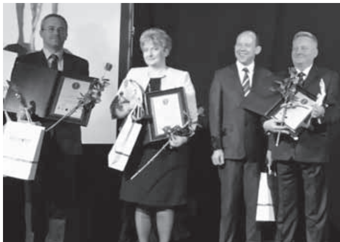
Perły Medycyny 2013