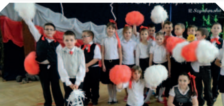
Konkurs „Moja mała ojczyzna” w Szkole Podstawowej w Nadrybju