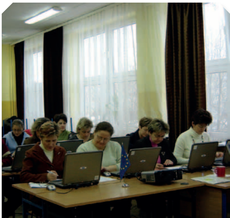
Bezpłatne szkolenia dla mieszkańców powiatu łęczyńskiego