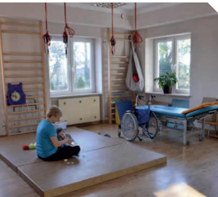
Nowa siedziba Ośrodka Rewalidacyjno – Wychowawczego