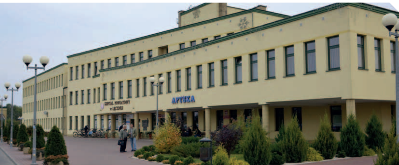
Szpital Powiatowy w Łęcznej