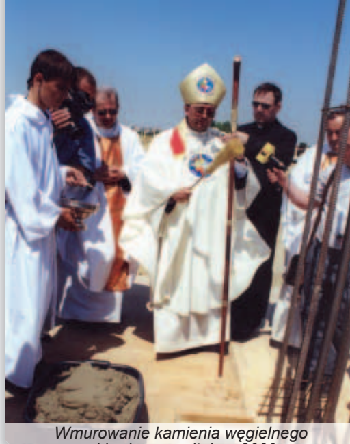
Wmurowanie kamienia węgielnego pod budowę szpitala – 2000 r.