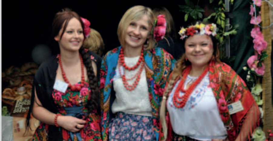
Stoisko promocyjnej Gminy Ludwin