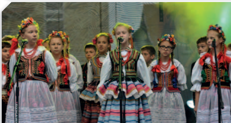
Występy folklorystyczne młodzieży z terenu powiatu łęczyńskiego