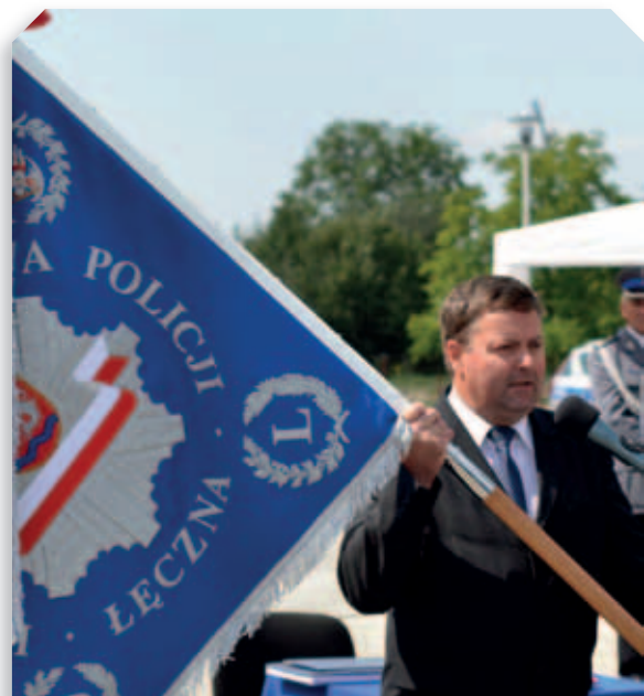
Otwarcie nowej siedziby i wręczenie sztandaru Komendzie Powiatowej Policji w Łęcznej – 2012 r.