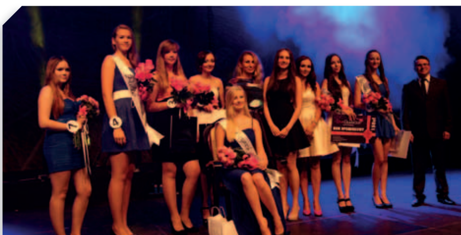
Finał konkursu „Wybory Miss Dożynek 2014”