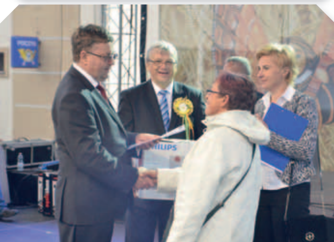
Wręczenie nagród laureatom konkursu potraw ekologicznych