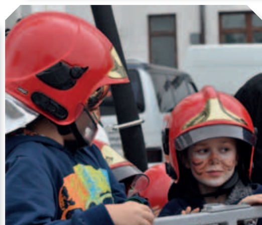
Prezentacja sprzętu Komendy Powiatowej Państwowej Straży Pożarnej w Łęcznej