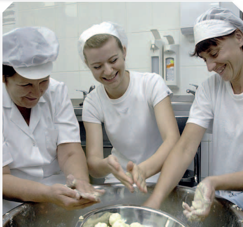
Powiatowy Zakład Aktywności Zawodowej