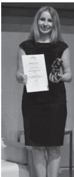
Złota @ 2014