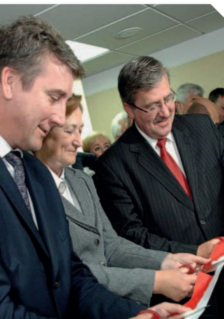
Otwarcie Szpitala Powiatowego w Łęcznej – 2009 r.