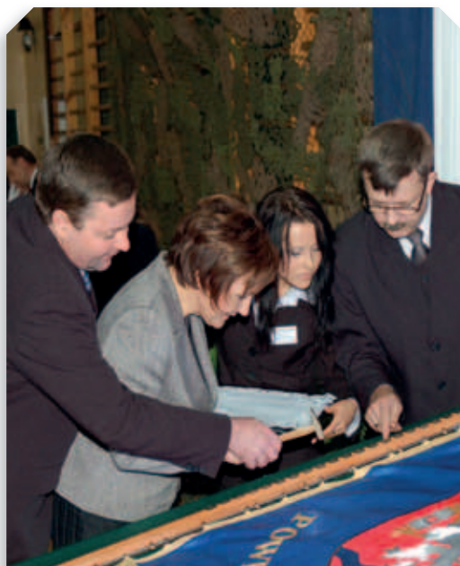
Uroczystość nadania sztandaru Powiatowi Łęczyńskiemu – 2007 r.