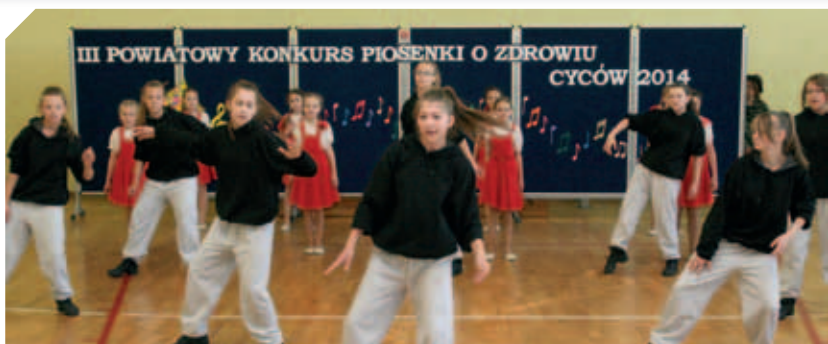
Powiatowy Konkurs Piosenki o Zdrowiu w ZS w Cycowie