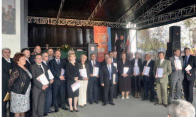
Pamiątkowe zdjęcie radnych Rady Powiatu