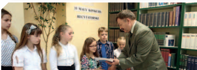
„Mały Konkurs Recytatorski” w Powiatowej Bibliotece Publicznej w Łęcznej