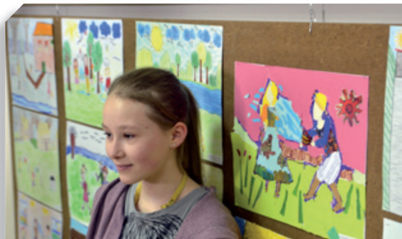
Konkurs plastyczny Symbole Świąt Wielkanocnych