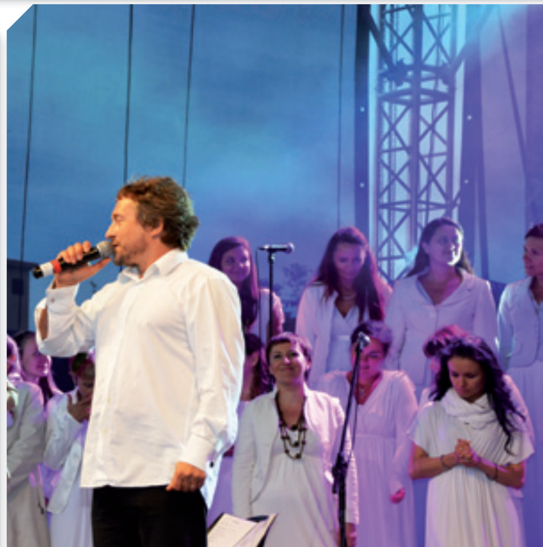
Koncert Chadek Gospel Choir