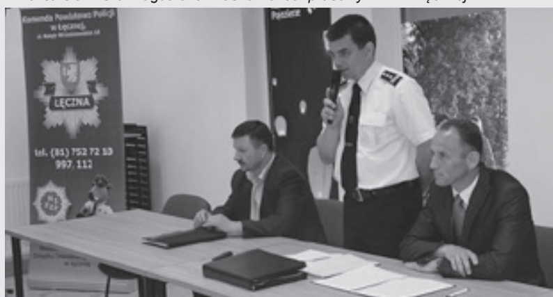
Komendant KPP w Łęcznej prezentuje uczestnikom pierwszej debaty stan bezpieczeństwa w powiecie

Tekst: sierż. szt. Magdalena Krasna - oficer prasowy KPP w Łęcznej