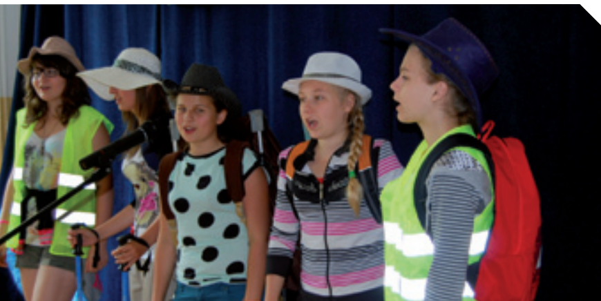
Powiatowy Przegląd Piosenki Turystycznej