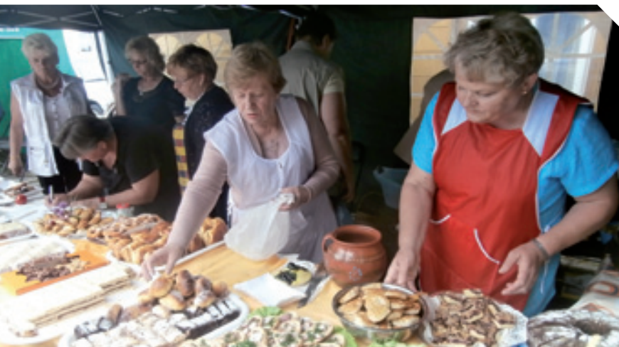
Eko – turystyczny smak powiatu łęczyńskiego