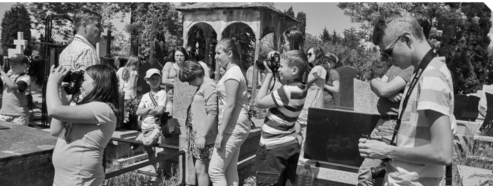
Miejsca pamięci narodowej w powiecie łęczyńskim - na nowo odkrywane przez młodzież