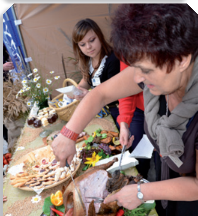
Regionalne przysmaki na stoisku Gminy Ludwin