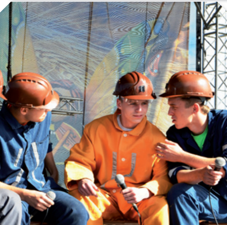
Kabaret Liberum Veto z ZSG w Łęcznej