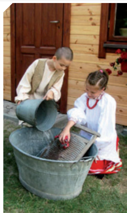
Prace w gospodarstwie