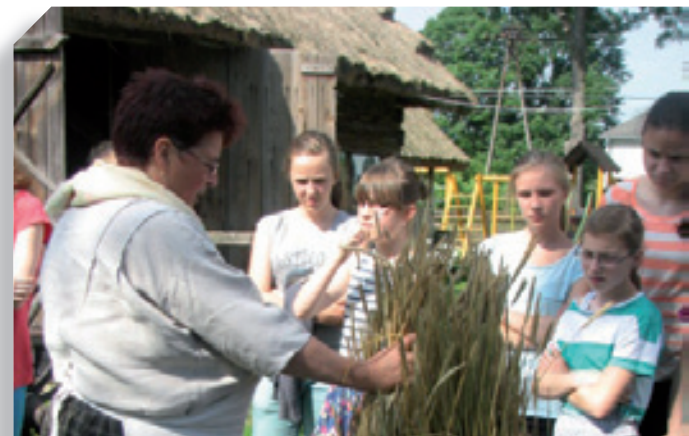
Warsztaty rękodzieła dla młodzieży w Hołownie