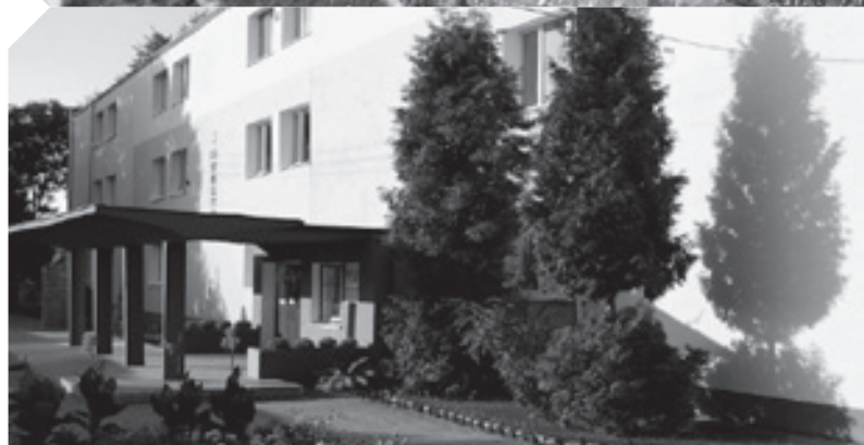
Reprezentacyjna rabata przy ZS im. K.K. Jagiellończyka w Łęcznej, fot. archiwum szkoły Efekty projektu przy ZS nr 2 im. S. Bolivara w Milejowie, fot. archiwum szkoły