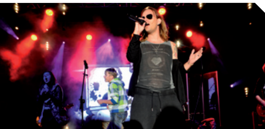
Gwiazda wieczoru – zespół Video