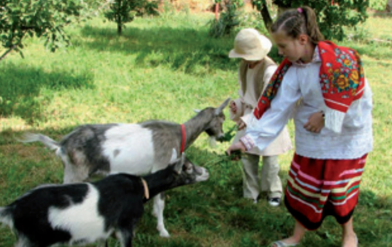
Spotkanie ze zwierzętami gospodarskimi