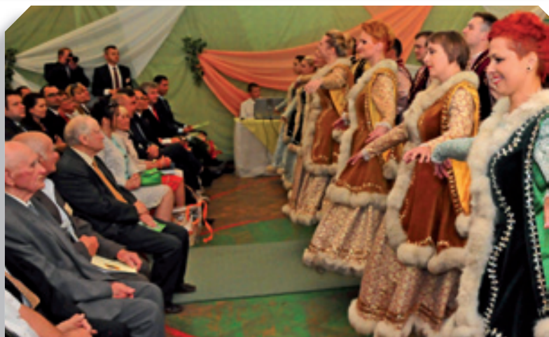
Polonez w wykonaniu absolwentów