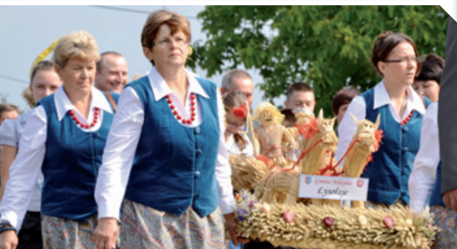
Korowód dożynkowy z wieńcami