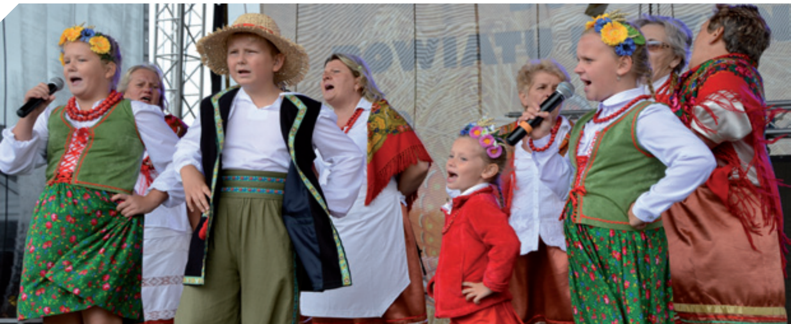
Występy folklorystyczne gmin powiatu łęczyńskiego