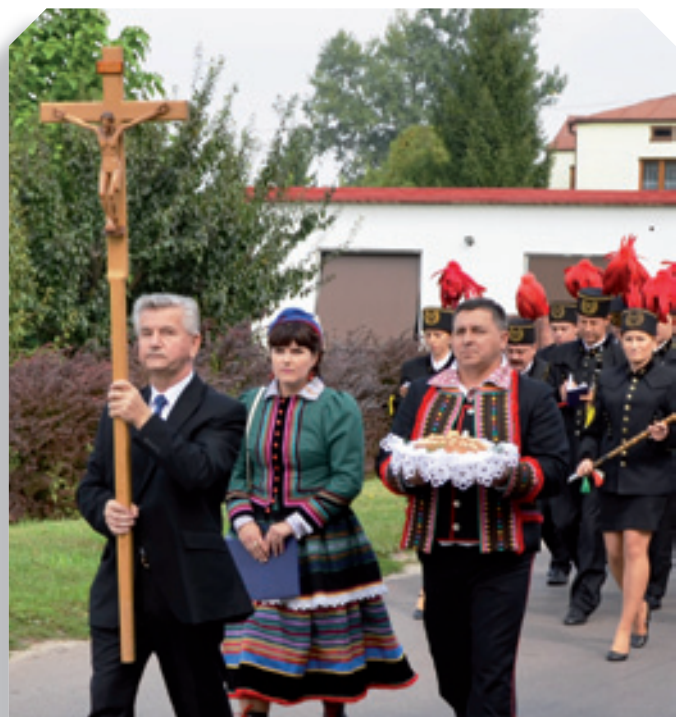
Starostowie dożynek z chlebem