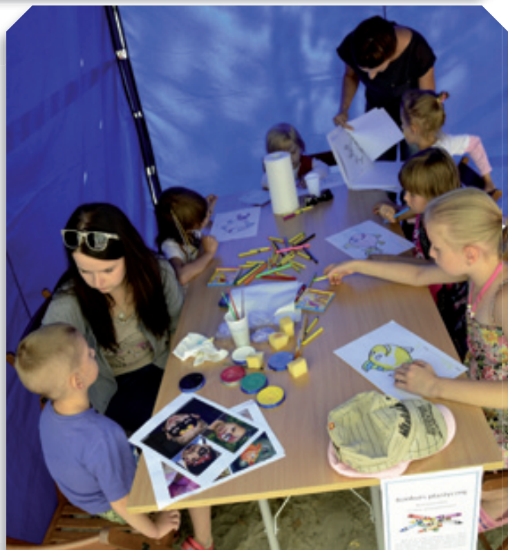
Atrakcje dla dzieci