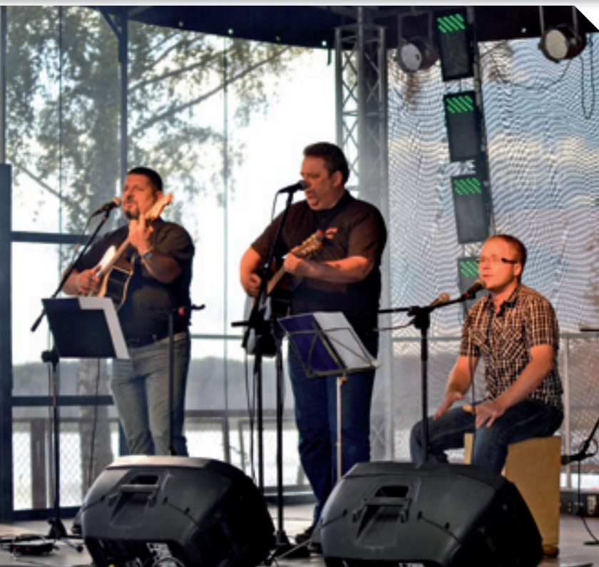
Koncert zespołu Syndrom Beczki