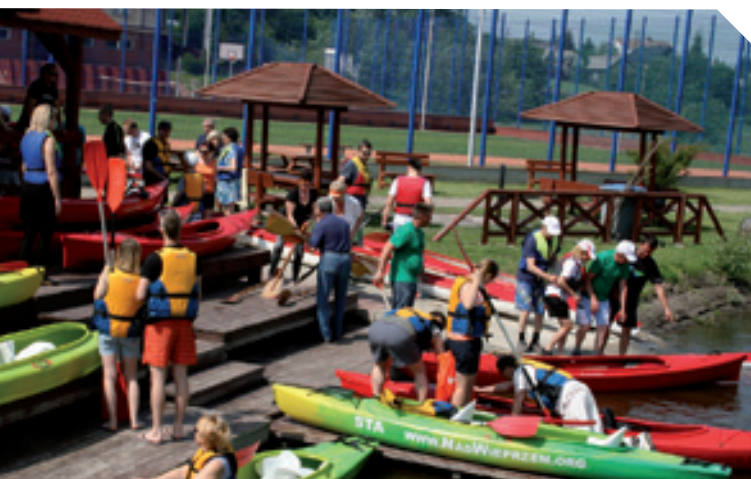
Spływ kajakowy rzeką Wieprz w Jaszczowie