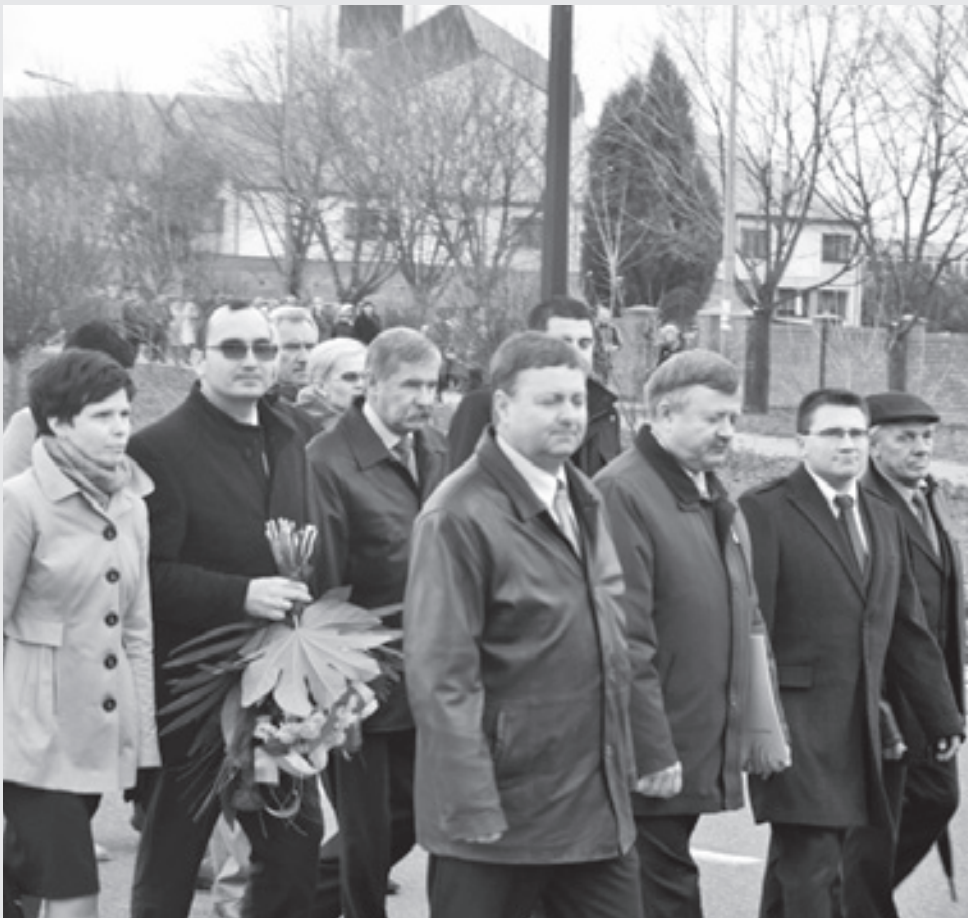
Uczestnicy powiatowych obchodów Święta Niepodległości

10 listopada uroczyste obchody Święta Niepodległości, zorganizowane przez członków Chorągwi Zamku w Zawieprzycach odbyły przy nowym pomniku powstańców styczniowych w Spiczynie. Tekst: Beata Cieślińska