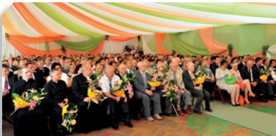
Najstarsi absolwenci otrzymali bukiety kwiatów