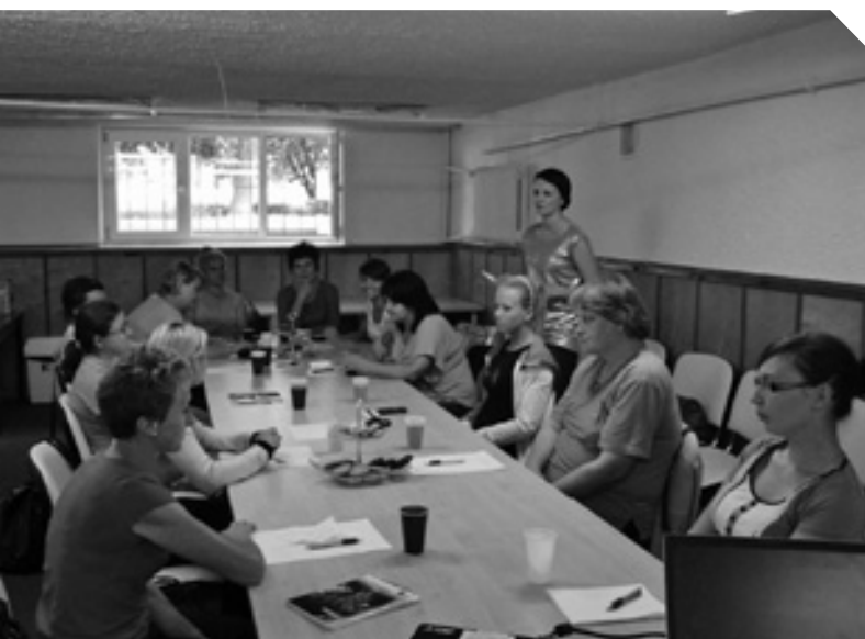
Spotkanie z doradcą w ramach projektu „Twoja szansa na sukces II”