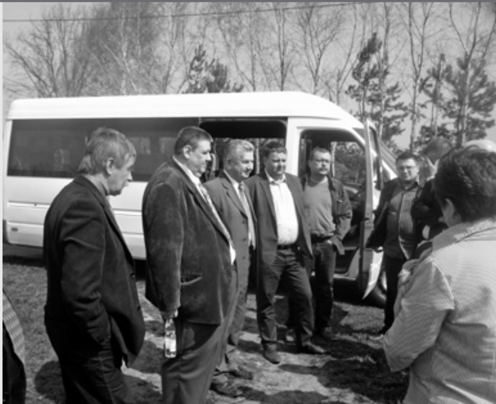
Przedstawiciele władz powiatu i gmin podczas objazdu dróg