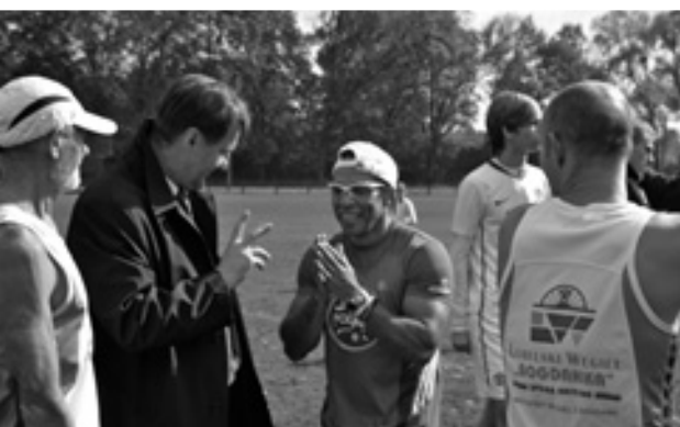
Uczestnicy Biegu Bolívara przed startem