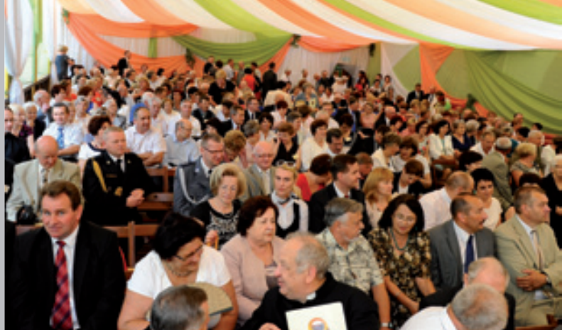
Jubileusz to okazja do rozmów po latach