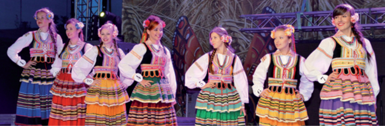
Wybory Miss Dożynek