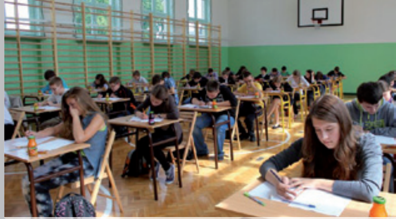
Powiatowy konkurs matematyczny „Od tabliczki do różniczki”