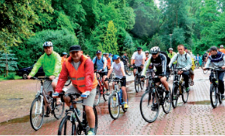
Kameralny Rajd Rowerowy