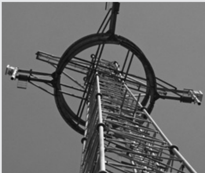
Stacja bazowa