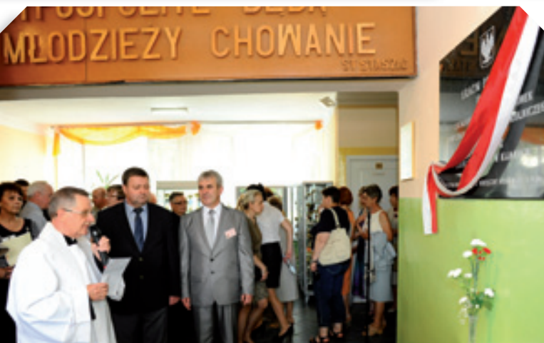
Uroczyste odsłonięcie tablicy fundatora szkoły