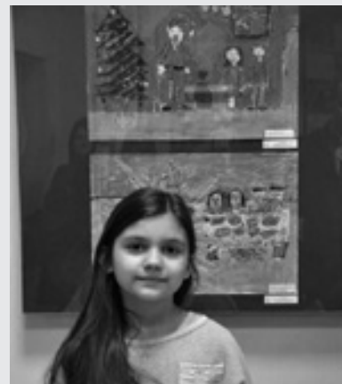
Konkurs Plastyczny „Święta Bożego Narodzenia”