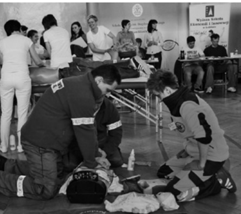
Pokazy masażu i ratownictwa w wykonaniu uczniów ZS w Ludwinie