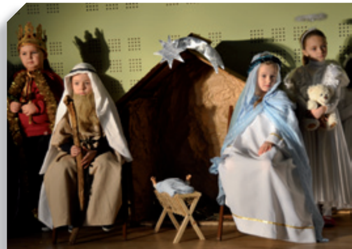
Zimowy Festiwal Teatralny Hej kolęda, kolęda