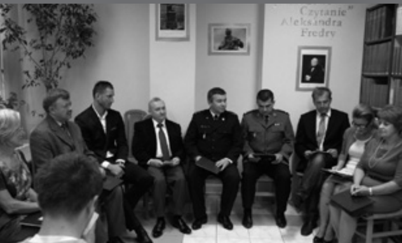
Akcja „Narodowe Czytanie. Aleksander Fredro” w Bibliotece Powiatowej

Mija kolejny już, 13 rok działalności PBP w Łęcznej. Składał się z szeregu działań skierowanych do naszych użytkowników, a służących rozwijaniu i zaspokajaniu nie tylko potrzeb czytelniczych i informacyjnych, ale również kulturalnych.