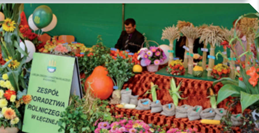
Wystawa produktów rolnych