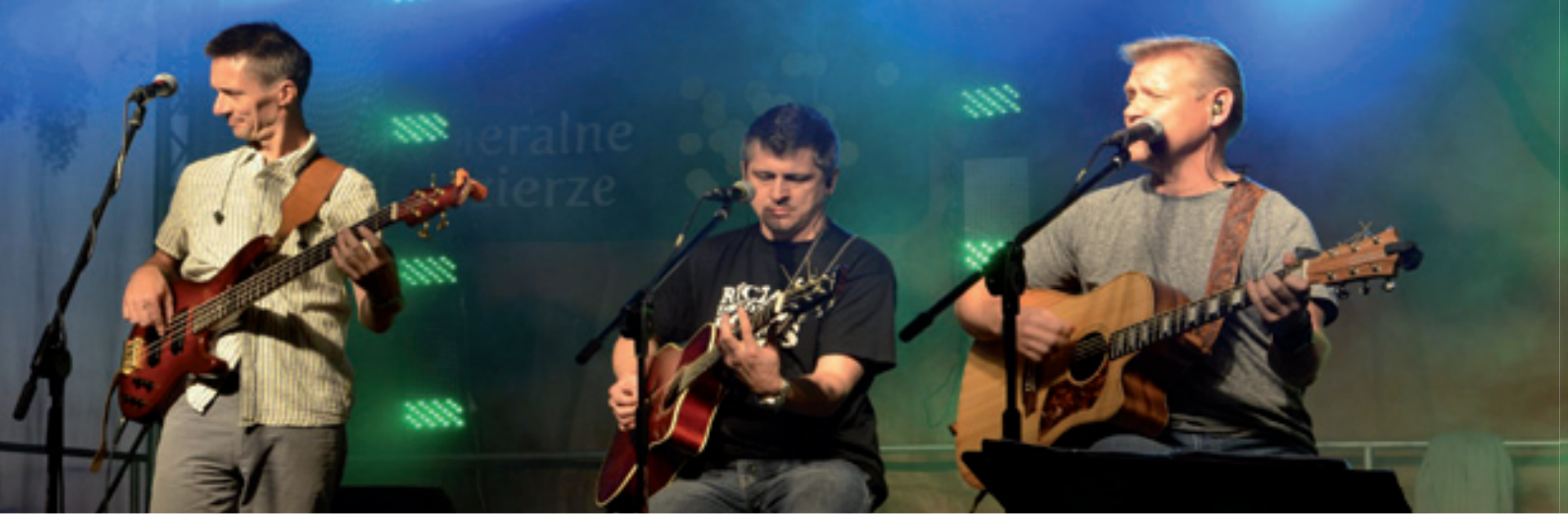
Gwiazda wieczoru - Ryczące Dwudziestki