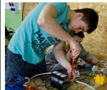
ZSG świetnie kształcą elektryków

w przemyśle maszynowym, budownictwie, górnictwie, transporcie, rolnictwie. Może być zatrudniony w sferze produkcyjnej i usługowej, głównie na stanowiskach średniego nadzoru technicznego. Po technikum może kontynuować naukę na uczelniach wyższych na kierunkach: mechanika i budowa maszyn, automatyka i robotyka, elektrotechnika, energetyka, inżynieria materiałowa, inżynieria mechaniczno-medyczna oraz wielu innych.