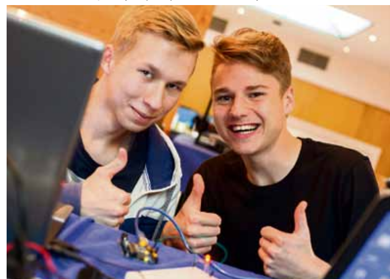
Informatycy z „Jagiellończyka” mają duże szanse na szybkie znalezienie pracy

ją pracę zawodową już w IV klasie. Nowością jest kierunek technik rachunkowości . Kształcony jest on zarówno w zakresie prowadzenia księgowości i rozliczania danin publicznych, jak i rozliczania wynagrodzeń, zgłaszania pracowników do ZUS oraz rozliczania należnych składek. Absolwent tego kierunku może pracować w biurach księgowych i rachunkowych, w działach finansowych, księgowych oraz kadrowych wszystkich przedsiębiorstw oraz w instytucjach finansowych, zakładach budżetowych i bankach.