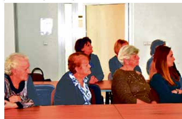
Seniorzy z uwagą wysłuchali prelekcji.