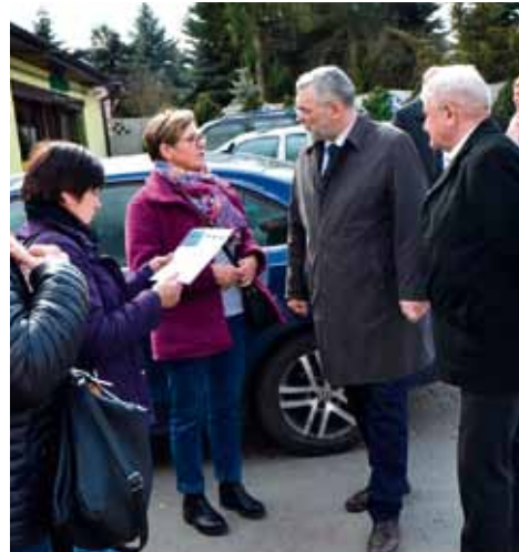
Starosta informuje o nowych programach rządowych.

Program zakłada odbudowanie autobusowej komunikacji publicznej poprzez dofinansowanie 0,80 zł do każdego kilometra. Projekt ma wejść w życie na przełomie kwietnia i maja.