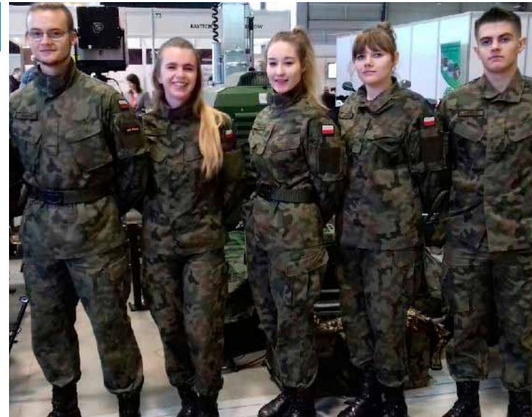
Klasa mundurowa w LO to duma milejowskiego „Bolívara”

Technik informatyk – przygotowuje do pracy jako: specjalista wykorzystujący technologie informatyczne stosowane na stanowiskach pracy, administrator sieci komputerowych, obsługa informatyczna, programista, serwisant komputerowy, prowadzenie własnej działalności w zakresie usług