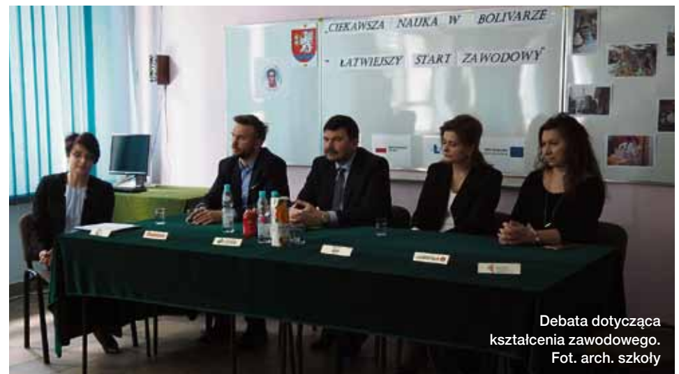
Debata dotycząca kształcenia zawodowego.