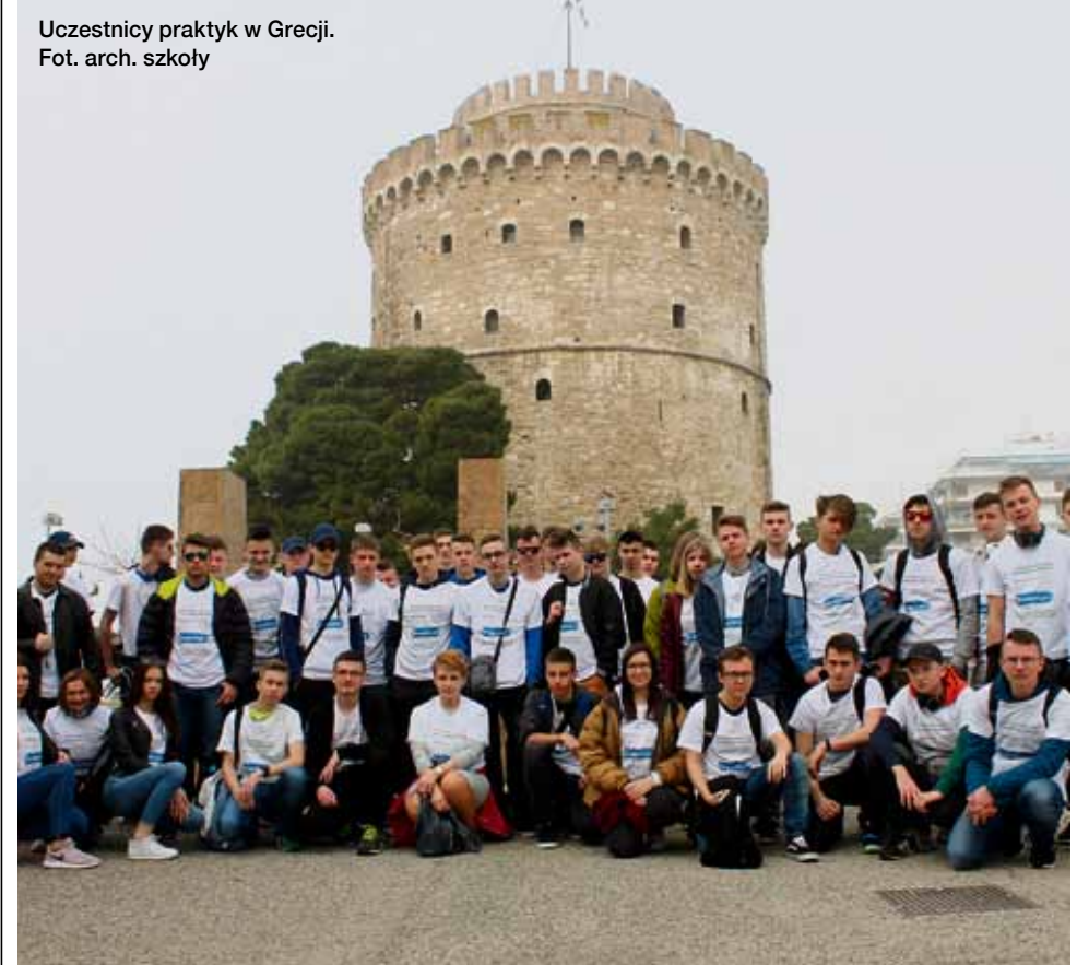
Uczestnicy praktyk w Grecji.