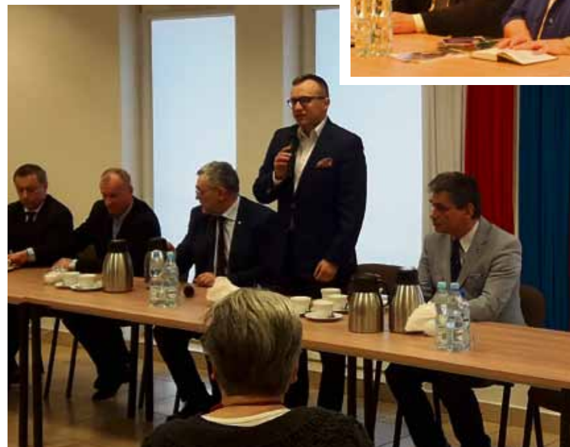
Wiceminister Artur Soboń podczas spotkania w Łęcznej.