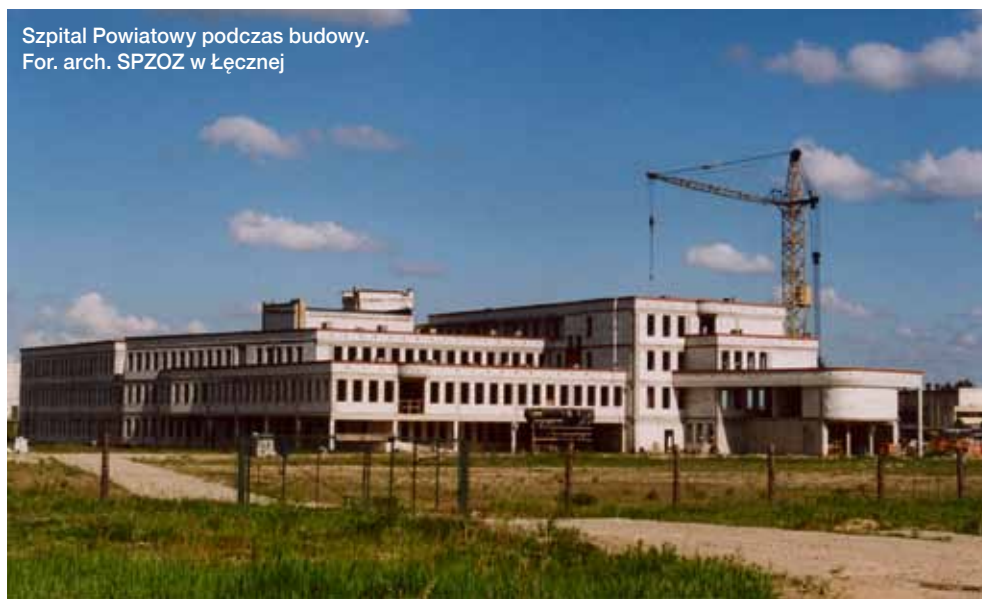
Szpital Powiatowy podczas budowy.