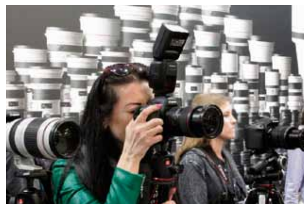
Atrakcyjny kierunek w ZS w Ludwinie - technik fotografii i multimedialnych

sowej digitalizacji fotografii amatorskiej, narzędziem najczęściej wykorzystywanym przez fototechnika jest komputer oraz zaawansowane oprogramowanie graficzne, a z drugiej artystyczny, gdyż umożliwia rozwijanie wrażliwości artystycznej, własnego stylu i profesjonalnego warsztatu.