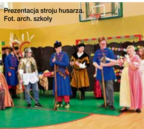
Prezentacja stroju husarza.