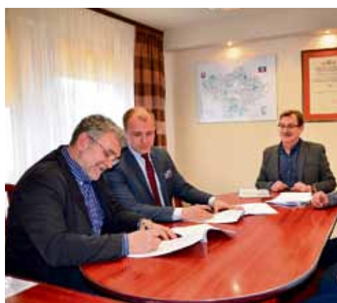
Uroczyste podpisanie umów.

19 marca zostały podpisane umowy z wykonawcą prac geodezyjnych polegających na modernizacji cyfrowych baz da-