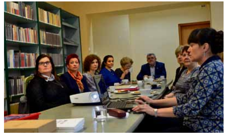
Podsumowanie działalności bibliotek publicznych z terenu naszego powiatu.

Mieszkańcy powiatu łęczyńskiego w 2018 r. mieli do dyspozycji 182 083 książki i 176 tytułów prenumerowanych czasopism, z których mogli korzystać w 7 bibliotekach głównych i 14 filiach. W ostatnim roku zbiory bibliotek wzrosły o 7 806 woluminów. Z 21 placówek skorzystało 14 535 czytelników, czyli o 283 więcej niż w 2017 r. Należy podkreślić, że należymy do elity czytelniczej w województwie lubelskim, w którym liczba czytających spadła o 7 016. Co czwarty mieszkaniec naszego powiatu czyta. Zasięg czytelnictwa wynosi 25,3 %, co daje nam pozycję lidera przy zasięgu wojewódzkim 17,1 %. Wyprzedzamy także sąsiadujące powiaty: chełmski z zasięgiem 11,9 %